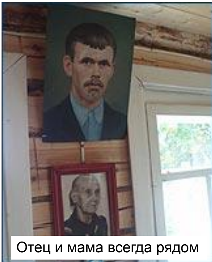
Отец и мама всегда рядом

С августа пятьдесят седьмого года по июнь шестьдесят второго я — студентка Литературного института имени А. М. Горького.