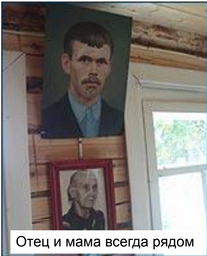
Отец и мама всегда рядом

С августа пятьдесят седьмого года по июнь шестьдесят второго я — студентка Литературного института имени А. М. Горького.