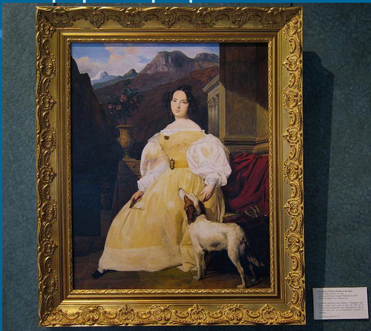
«Графиня Ганская в желтом платье» Портрет графини Ганской в желтом платье с белыми кружевами и пышными рукавами. Картина написана в 1800 году в Вене. В настоящее время находится в коллекции Государственного Эрмитажа.