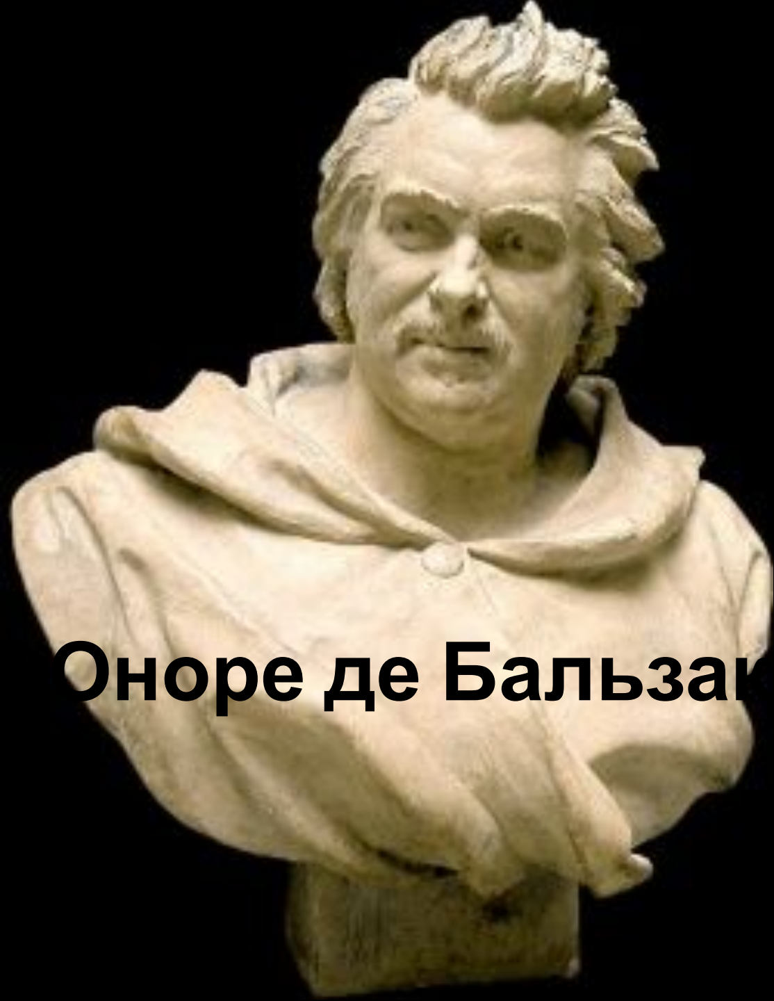
Оноре де Бальзак