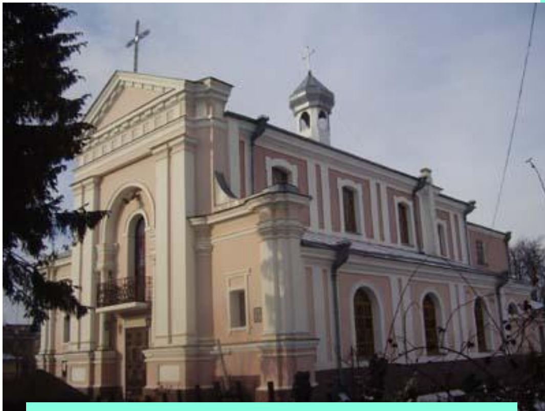
Костьол Святої Варвари міста Бердичів

У 1850 році одружився з Евеліною Ганською.