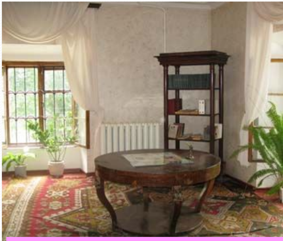
Робочий стіл Бальзака у Верхівні