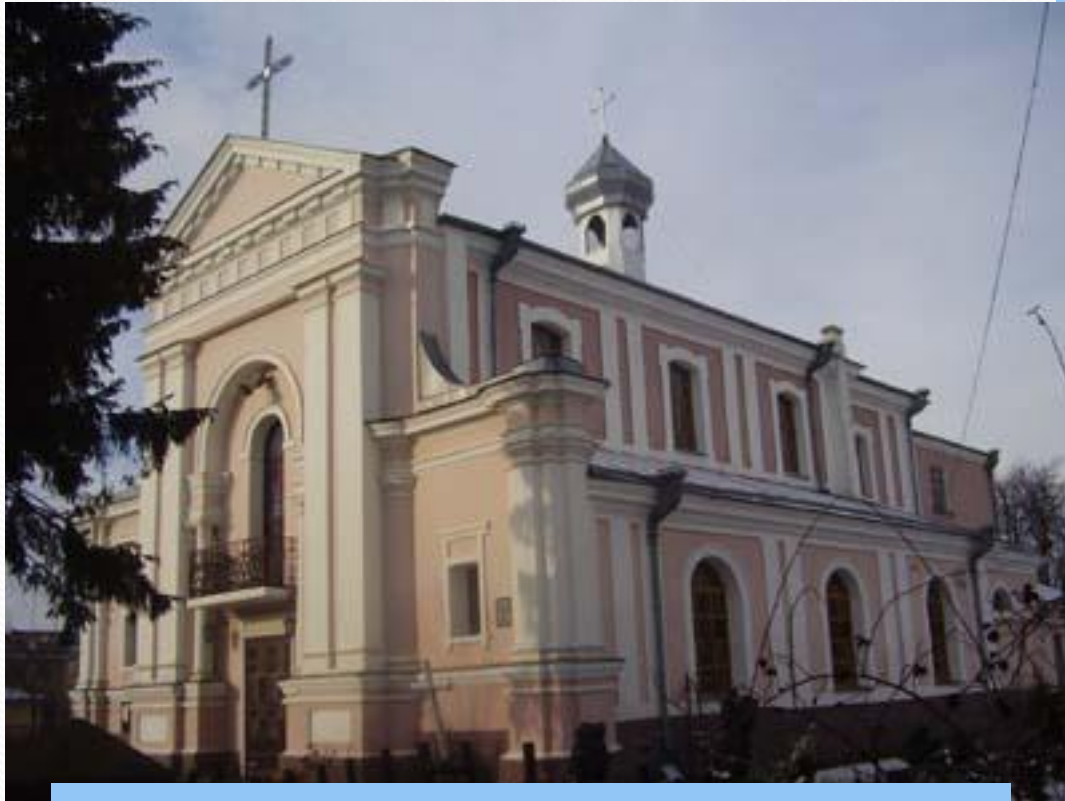
Костьол Святої Варвари міста Бердичів

У 1850 році одружився з Евеліною Ганською. Вінчання відбулося 2 березня 1850 року в костьолі Святої Варвари міста Бердичів.