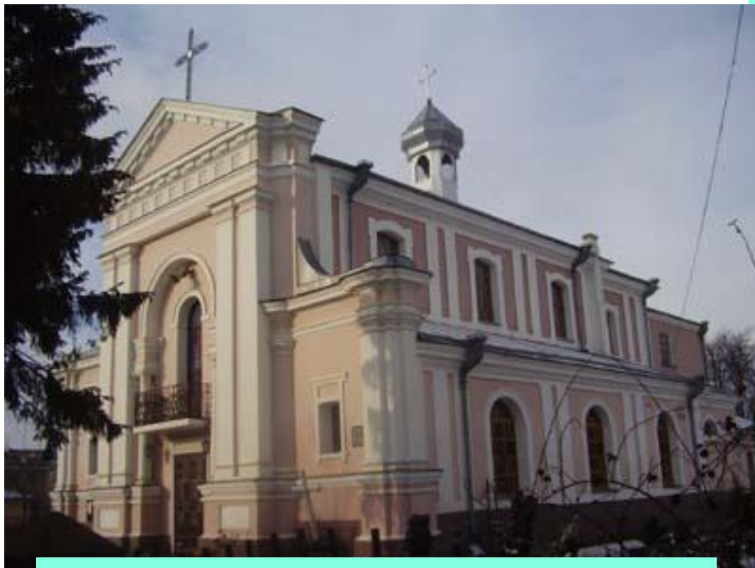
Костьол Святої Варвари міста Бердичів

У 1850 році одружився з Евеліною Ганською.