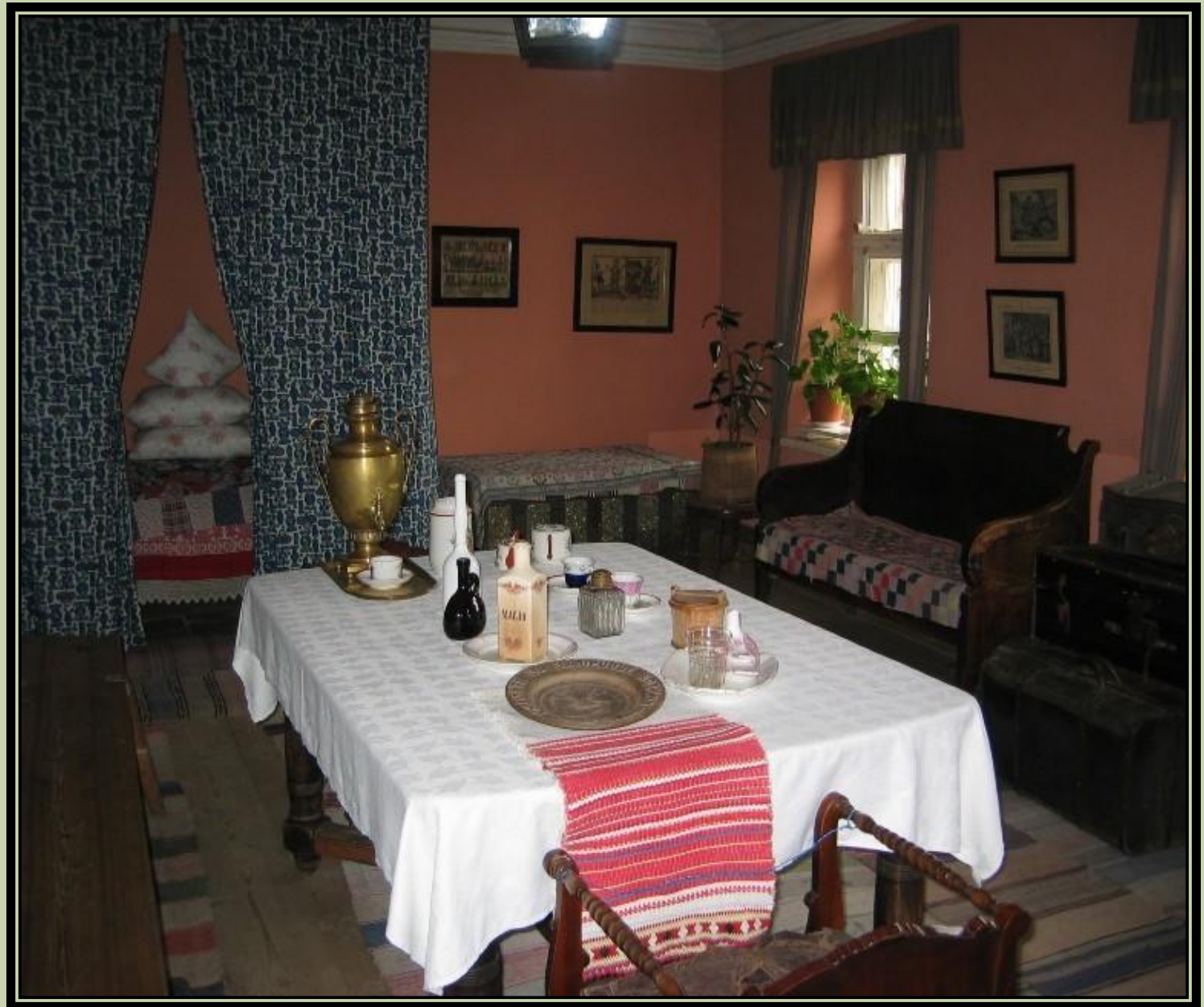
А.С.Пушкин «Станционный смотритель»

Обитель – 1. монастырь. 2. поэтич. место пребывания, жилище. (9)