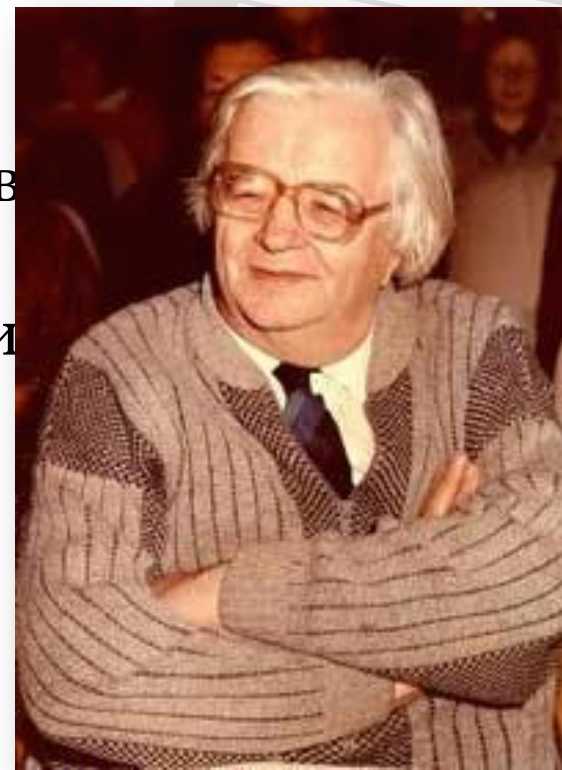
Валентин Дмитриевич Берестов

Родился Валентин Берестов в маленьком, тихом городке 1 апреля , в семье учителя истории. Отец будущего поэта и сам писал в юности стихи, и сыну сумел привить любовь к чтению. Поэтические способности у мальчика обнаружались очень рано. Он записывал стихи в тетрадь и хранил её в тайнике. Было это в 1942 году в Ташкенте, где в эвакуации жила семья Берестовых. В 1944 они перебралась в Подмосковье. В Москве Валентин Дмитриевич поступил на исторический факультет МГУ, затем в аспирантуру института этнографии. В 1946 году его произведения начинают публиковаться в печати. А в 1957 выходят его первый поэтический сборник «Отплытие» и тоненькая книжка для дошкольников «Про машину».