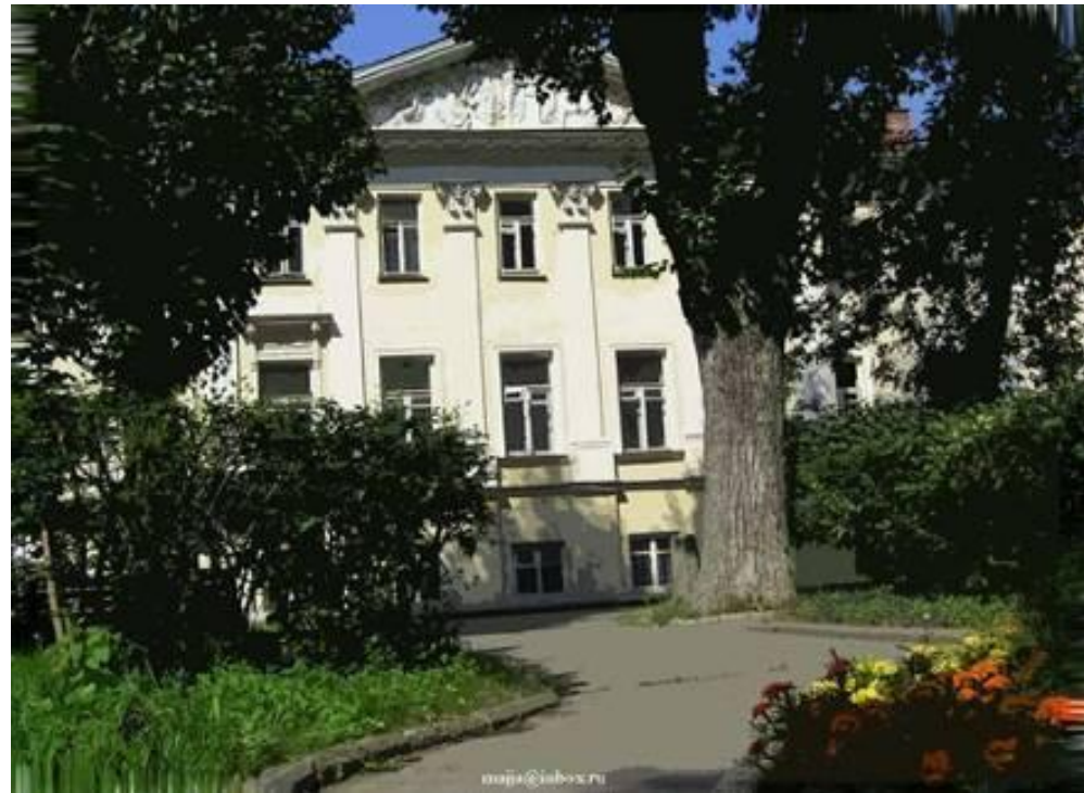
Дом Герцена( Грибоедова). Москва, Тверской бульвар, 25

Очень символично, с иронией изображает автор обстановку, царящую в доме литературных работников: «у посетителей начинали разбегаться глаза от надписей, пестревших на дверях: «Рыбно-дачная секция», «Квартирный вопрос», «Полнообъемные творческие отпуска от двух недель до одного года» и т.д. У каждой двери толпится очередь. Таким образом, писатели превратились из литераторов в людей, озабоченных получением путевок, дач, квартир - всем, кроме искусства.