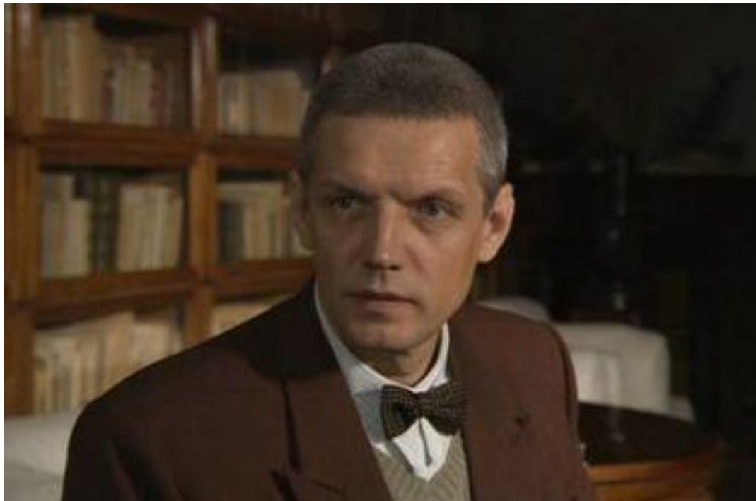
Александр Галибин в роли Мастера. Сериал «Мастер и маргарита». 2005 год. Реж. Владимир Бортко.