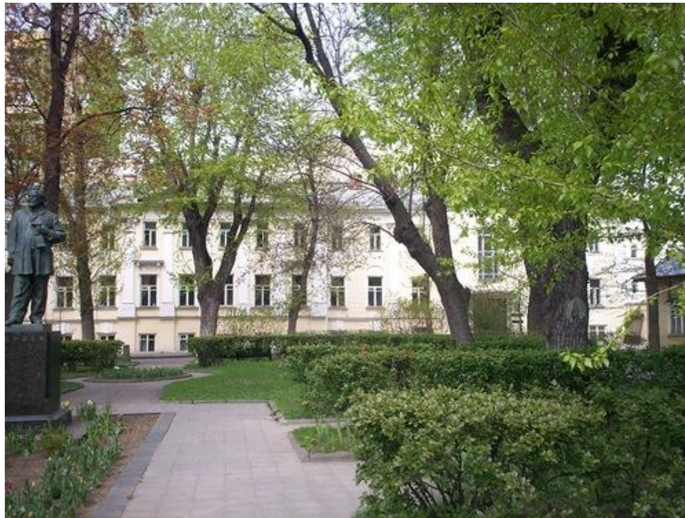
Дом Герцена( Грибоедова). Москва, Тверской бульвар, 25