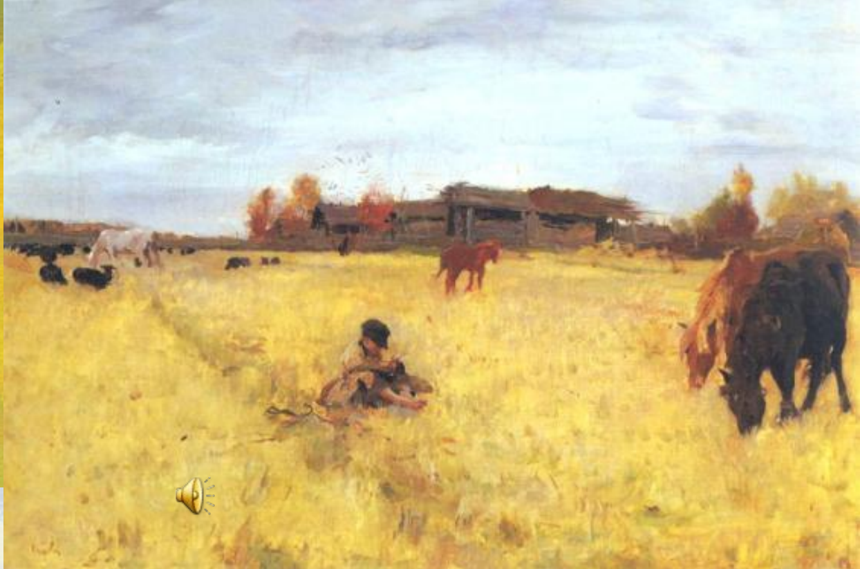
И.И. Левитана "Золотая осень"