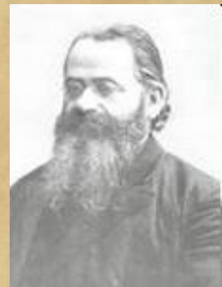
Семен Афанасьевич Венгеров

Эти фразы не приносят какую-то добавочную, конкретную черту, а возводят описываемый предмет в общенациональный ранг. Описательная функция дополняется здесь другой – обобщающей.