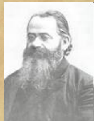
Семен Афанасьевич Венгеров

Эти фразы не приносят какую-то добавочную, конкретную черту, а возводят описываемый предмет в общенациональный ранг. Описательная функция дополняется здесь другой – обобщающей.