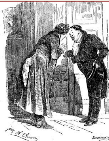
Иллюстрации А.Агина 1892 год

В свое время профессор древней истории В.П.Бузескул обратил внимание на противоречия в обозначении времени действия поэмы. Гоголь изменил эту привычную для нас последовательность, сократив ее до одного дня или же ночи. Для чего это ему нужно было?