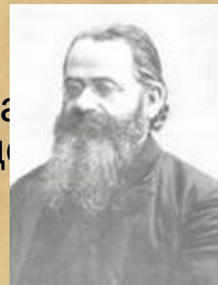
Семен Афанасьевич Венгеров

Эти фразы не приносят какую-то добавочную, конкретную черту, а возводят описываемый предмет в общенациональный ранг. Описательная функция дополняется здесь другой – обобщающей.