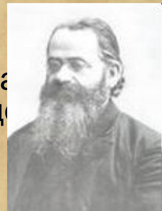
Семен Афанасьевич Венгеров

Эти фразы не приносят какую-то добавочную, конкретную черту, а возводят описываемый предмет в общенациональный ранг. Описательная функция дополняется здесь другой – обобщающей.