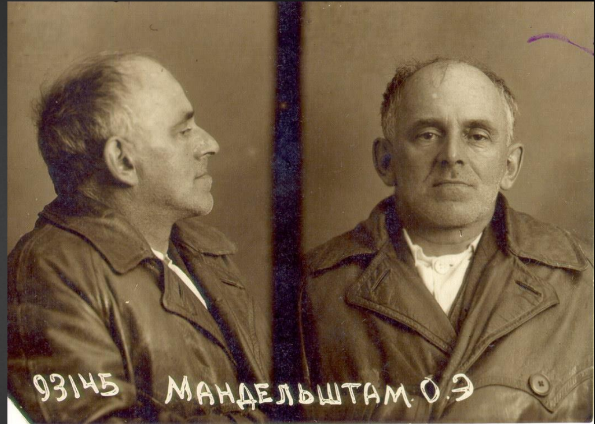
Последняя фотография Осипа Мандельштама

Только защита Бухарина смягчила приговор - выслали в Чердынь-на-Каме, где пробыл две недели, заболел, попал в больницу. Был отправлен в Воронеж, где работал в газетах и журналах, на радио. После окончания срока ссылки возвращается в Москву, но здесь ему жить запрещают. Живет в Калининe. Получив путевку в санаторий, уезжает с женой в Саматиху, где он был вновь арестован. Приговор - 5 лет лагерей за контрреволюционную деятельность. Этапом был отправлен на Дальний Восток. 27 декабря 1938 г. Мандельштам скончался от тифа в пересыльном лагере Владперпункт (Владивосток).