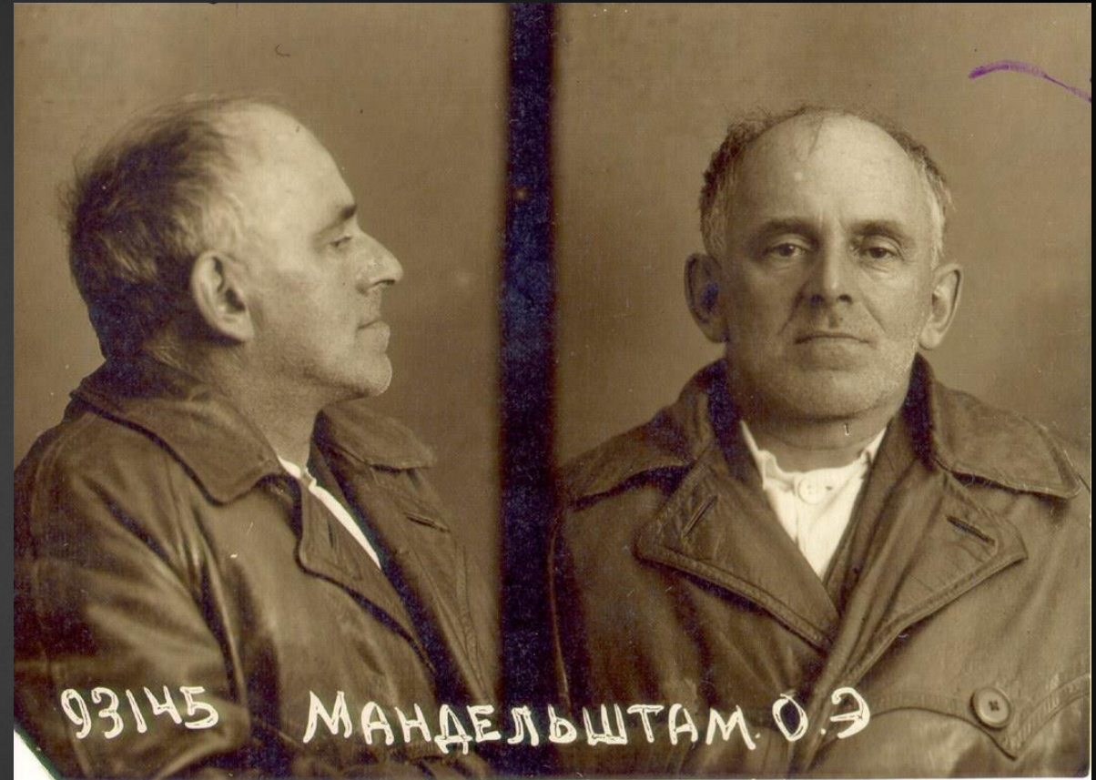
Последняя фотография Осипа Мандельштама

Только защита Бухарина смягчила приговор - выслали в Чердынь-на-Каме, где пробыл две недели, заболел, попал в больницу. Был отправлен в Воронеж, где работал в газетах и журналах, на радио. После окончания срока ссылки возвращается в Москву, но здесь ему жить запрещают. Живет в Калининe. Получив путевку в санаторий, уезжает с женой в Саматиху, где он был вновь арестован. Приговор - 5 лет лагерей за контрреволюционную деятельность. Этапом был отправлен на Дальний Восток. 27 декабря 1938 г. Мандельштам скончался от тифа в пересыльном лагере Владперпункт (Владивосток).