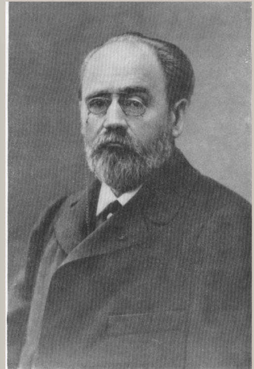
ЭМИЛЬ ЗОЛЯ. Фотография. [Конец 80-х годов].