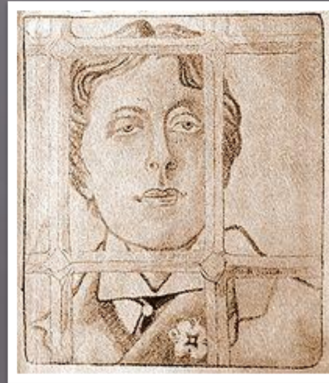
Баллада Реддингской тюрьмы. Рис. М. Дурнова (1904)

□ После выхода из тюрьмы он уезжает в Париж, сменив имя на Мельмота. Во Франции Уайльд написал знаменитую поэму «Баллада Реддингской