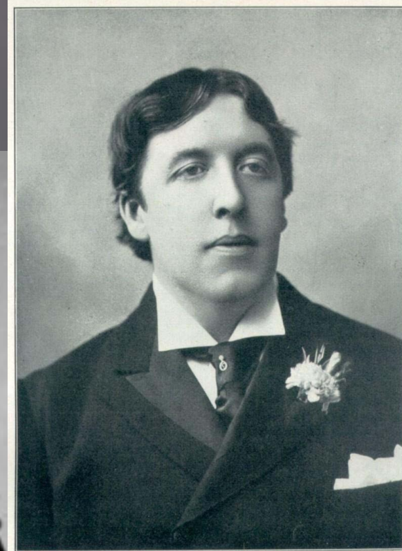
Abb. 289. Oscar Wilde.