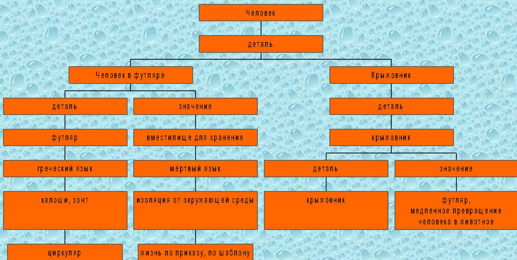
Схема деталей в трилогии Чехова