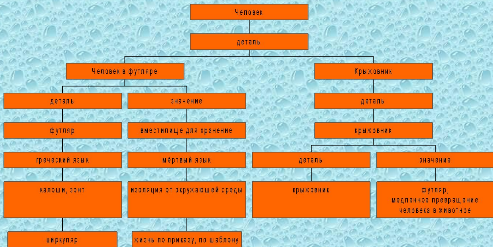
Схема деталей в трилогии Чехова