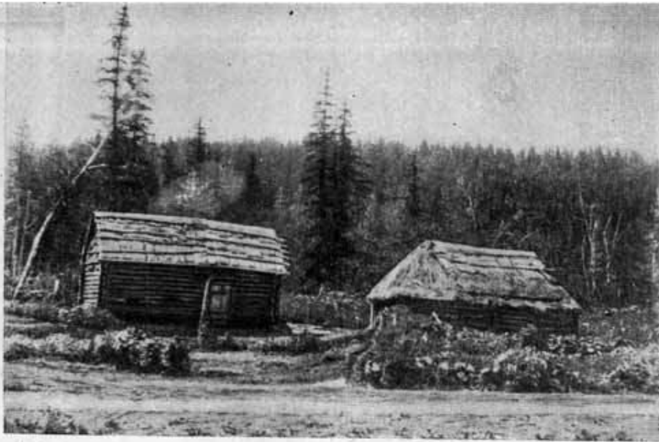
УСАДЬБА ПОСЕЛЕНЦА, ДОМОХОЗЯИНА БЕДНЯКА (в д. КРАСНОМ ЯРУ)*