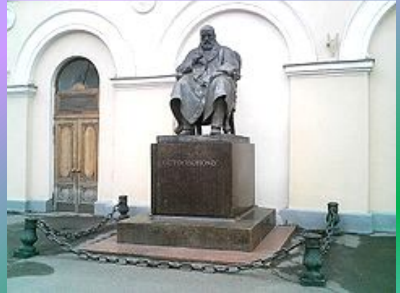
ПАМЯТНИК ОСТРОВСКОМУ У МАЛОГО ТЕАТРА

Детство и юность писателя прошло в Замоскворечье.. Отец женился второй раз на дочери обрусевшего шведского барона, которая не слишком занималась воспитанием детей от первого брака своего мужа. Островский был предоставлен самому себе, ещё в детстве пристрастился к чтению.