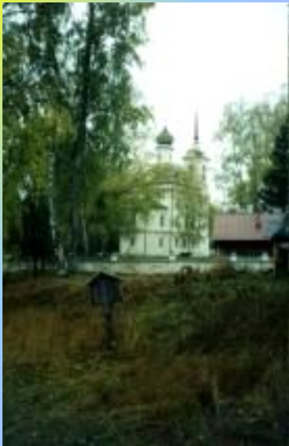
церковь Николы на Бережках.

Эту необычную и замечательную в архитектурном и живописном плане церковь мог построить только очень богатый помещик.