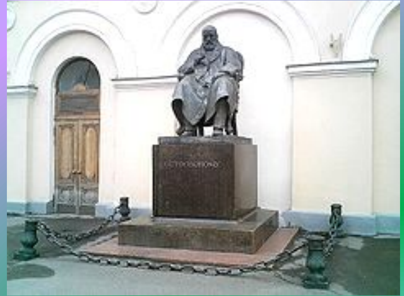
ПАМЯТНИК ОСТРОВСКОМУ У МАЛОГО ТЕАТРА

Детство и юность писателя прошло в Замоскворечье.. Отец женился второй раз на дочери обрусевшего шведского барона, которая не слишком занималась воспитанием детей от первого брака своего мужа. Островский был предоставлен самому себе, ещё в детстве пристрастился к чтению.