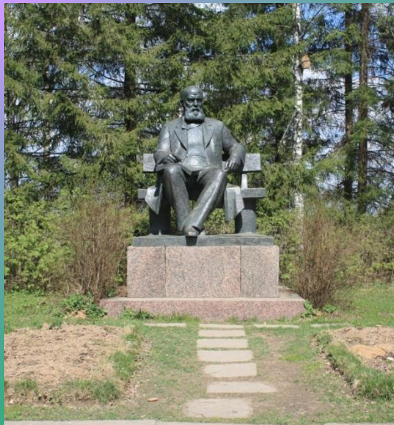
Памятник Островскому в Щельково