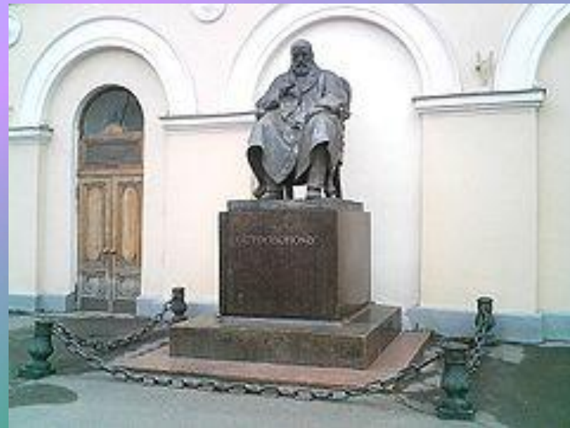
ПАМЯТНИК ОСТРОВСКОМУ У МАЛОГО ТЕАТРА

Детство и юность писателя прошло в Замоскворечье.. Отец женился второй раз на дочери обрусевшего шведского барона, которая не слишком занималась воспитанием детей от первого брака своего мужа. Островский был предоставлен самому себе, ещё в детстве пристрастился к чтению.