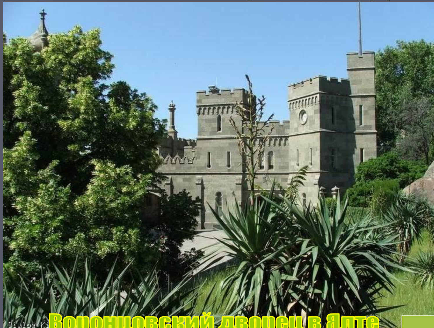
Воронцовский дворец в Ялте