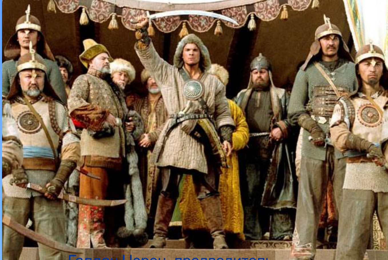
Галдан Цэрен- предводитель джунгар

Только объединив усилия трех жузов, казахский народ отразил нашествие джунгар, с честью прошел самые страшные испытания времен "Великого бедствия" в первой половине XVIII века, сумел отстоять свою землю, сохранить себя как народ и выйти из испытаний окрепшим.