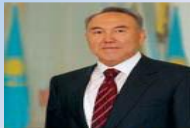
Председатель Ассамблеи народа Казахстана