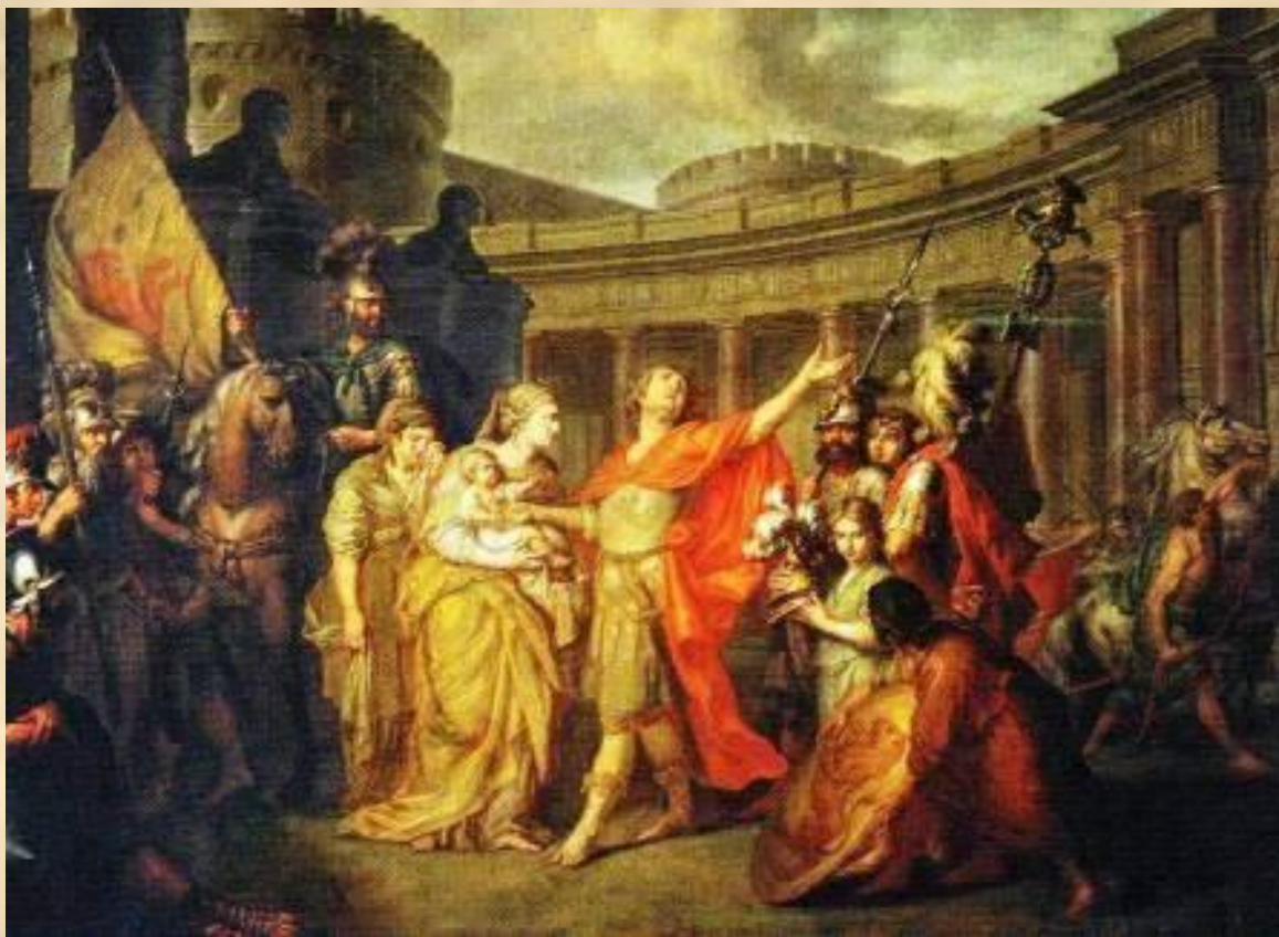
А.П.Лосенко. Прощание Гектора с Андромахой. 1773