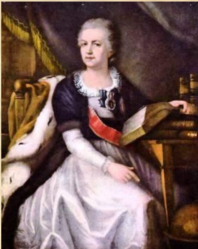
Неизвестный художник. Портрет Е.Р. Дашковой.