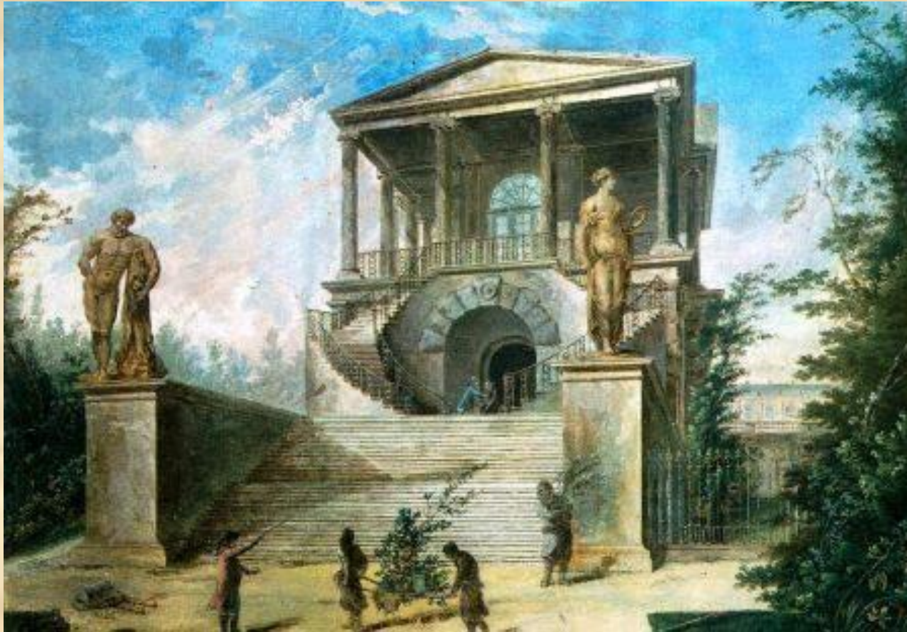
Большой каменный театр.