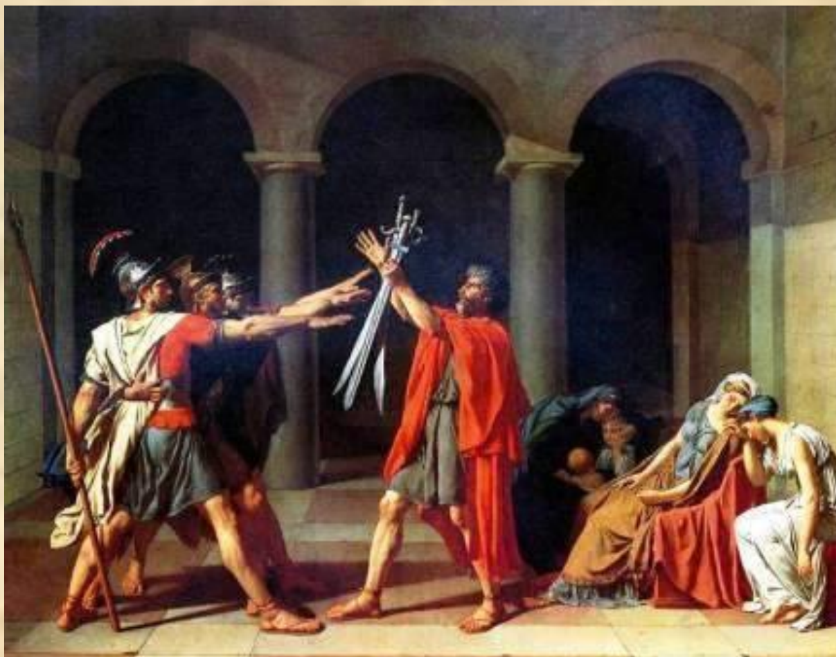
Жак Луи Давид. Клятва Горациев. 1785