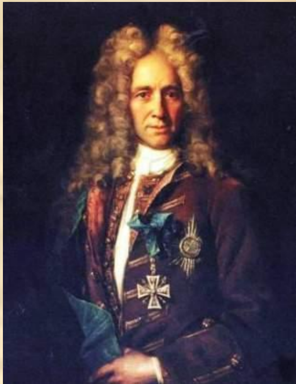
И.Н.Никитин. Портрет канцлера графа Г.И. Головкина. 1720-е