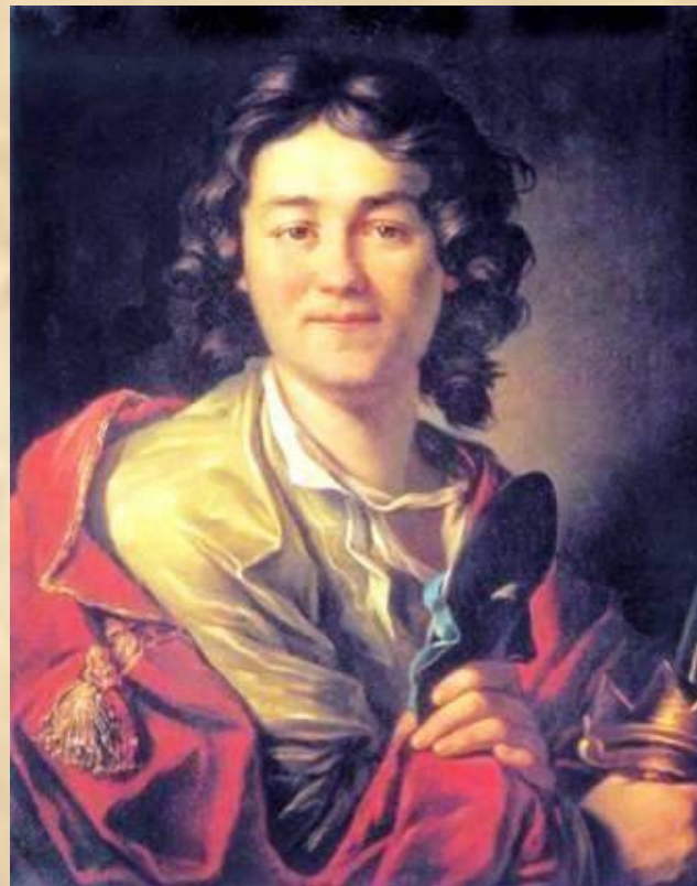
А.П.Лосенко Портрет актёра Ф.Волкова.