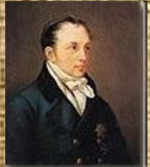
Егор Антонович Энгельгардт. С марта 1816 — директор Лицея.

И первую полней, друзья, полней! И всю до дна в честь нашего союза! Благослови, ликующая муза, Благослови: да здравствует лицей! Наставникам, хранившим юность нашу, Всем честью, и мертвым и живым, К устам подъяв признательную чашу, Не помня зла, за благо воздадим.