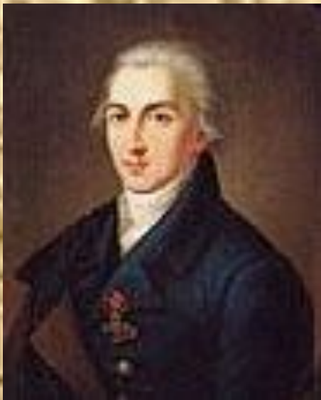
Василий Федорович Малиновский первый директор Царскосельского лицея