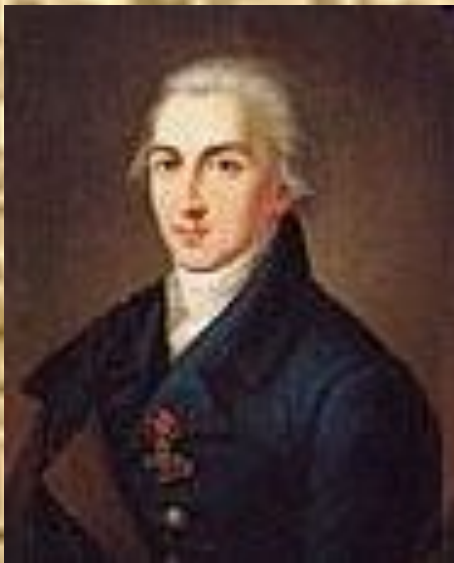
Василий Федорович Малиновский первый директор Царскосельского лицея