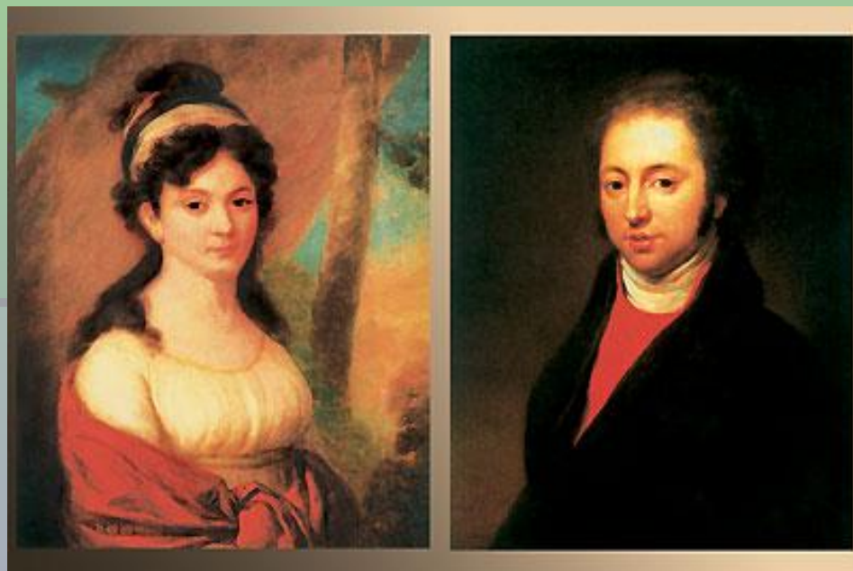
Родители Ф. И. Тютчева