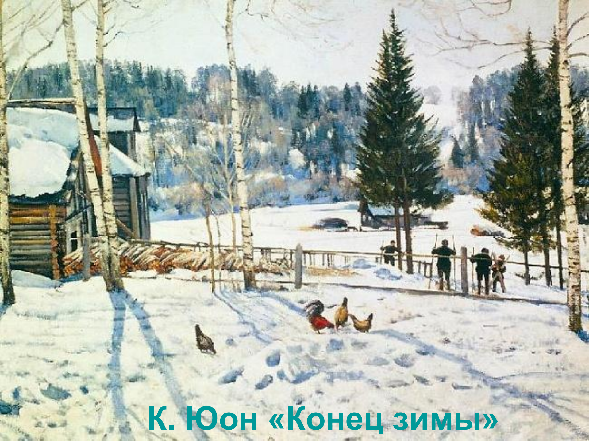
К. Юон «Конец зимы»