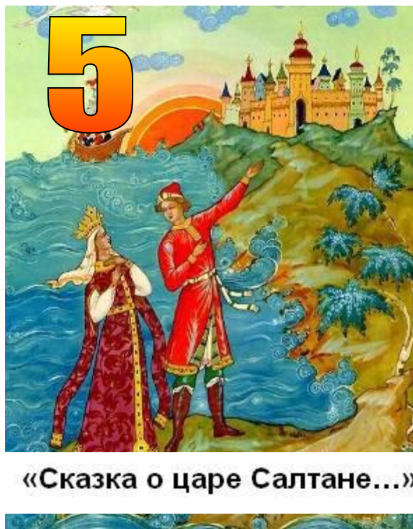
«Сказка о царе Салтане...»