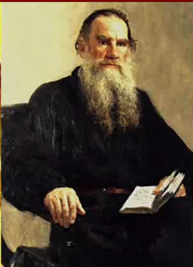
Лев Николаевич Толстой