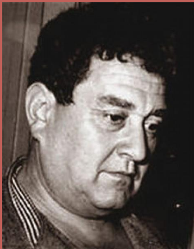
Драгунский Виктор Юзефович