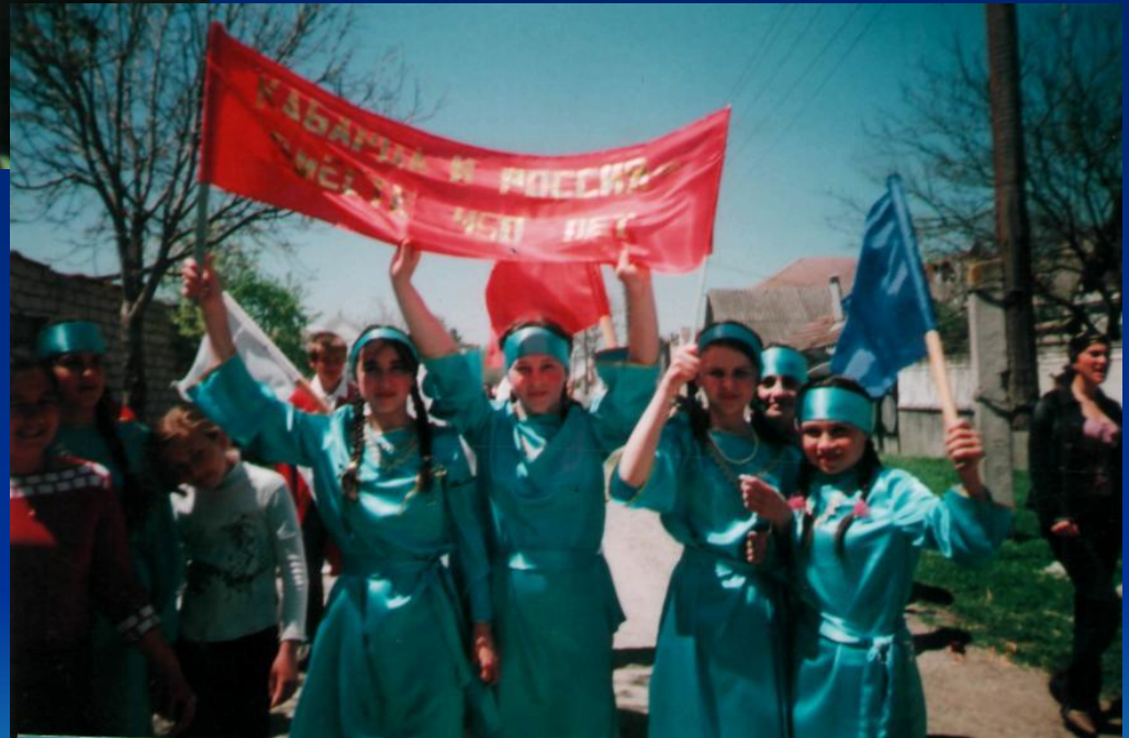
Участники танцевального конкурса