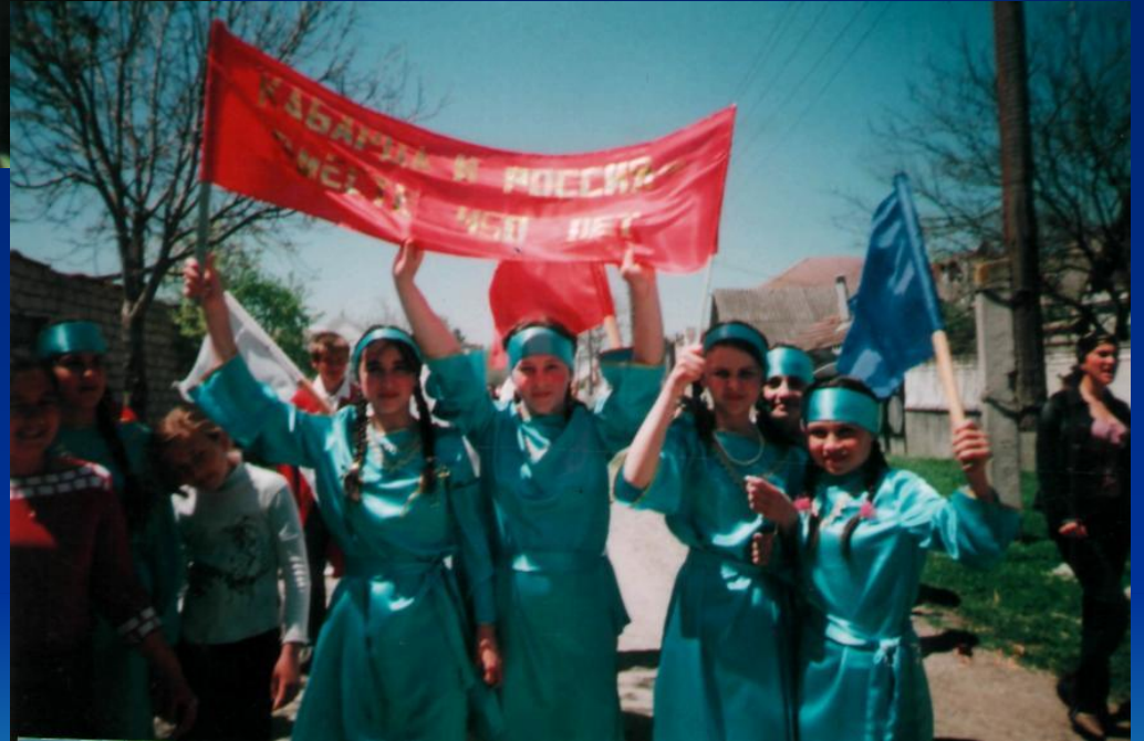
Участники танцевального конкурса