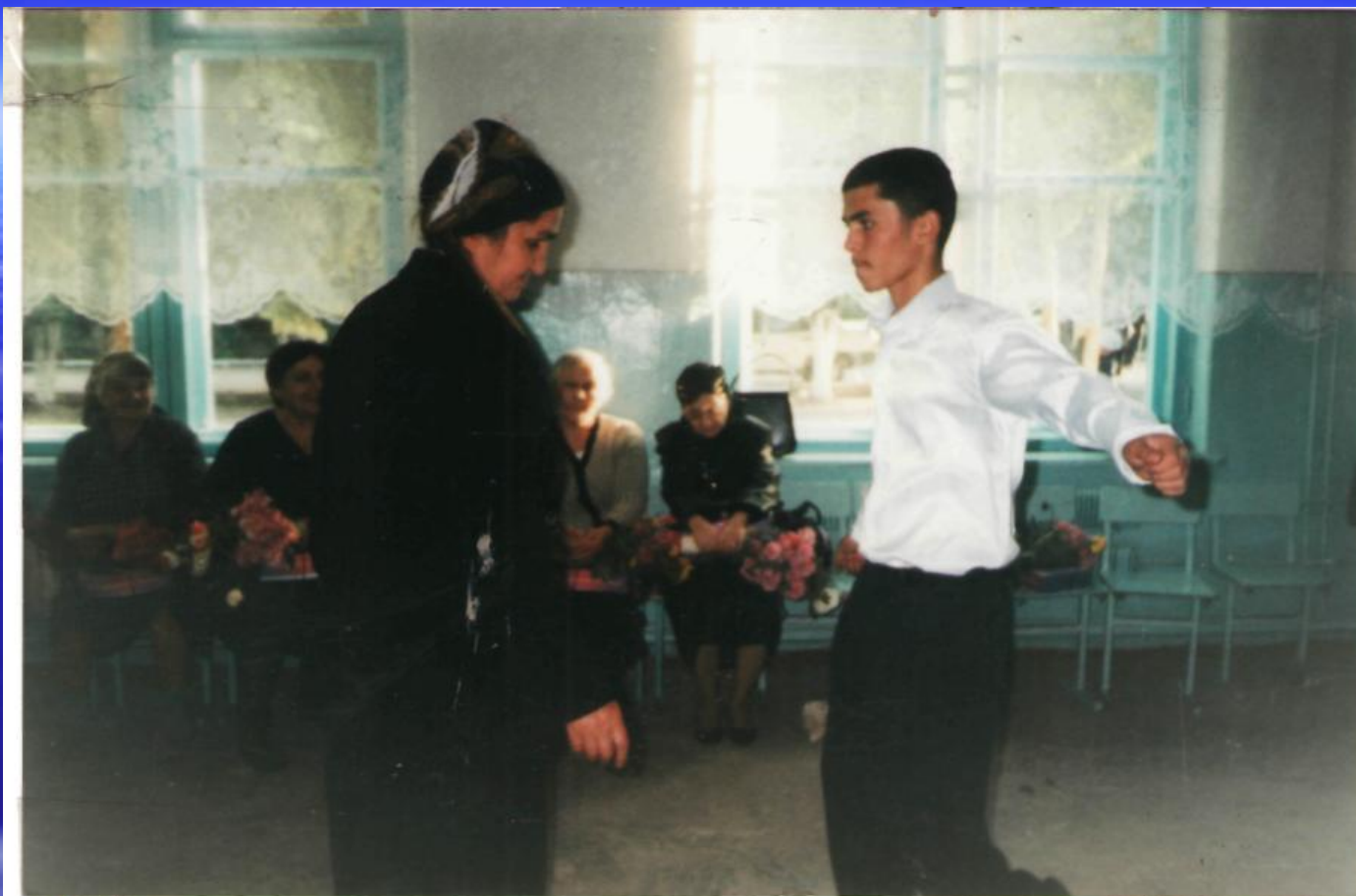
Внеклассное мероприятие ко Дню учителя