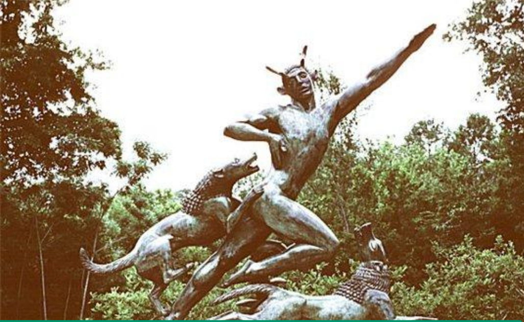
(Актеон. Южная Каролина, Брукгрин гарденс)

3. Из мифа об Актеоне, который подсматривал за купающейся богиней Дианой и за это был превращен ею в оленя. Актеон употребляется в значении «рогоносец, обманутый муж».