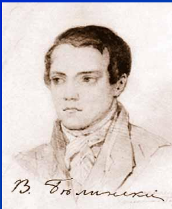
В.Г.Белинский (либерал- западник)