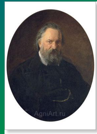
Н.Г. Чернышевский (революционер- демократ)