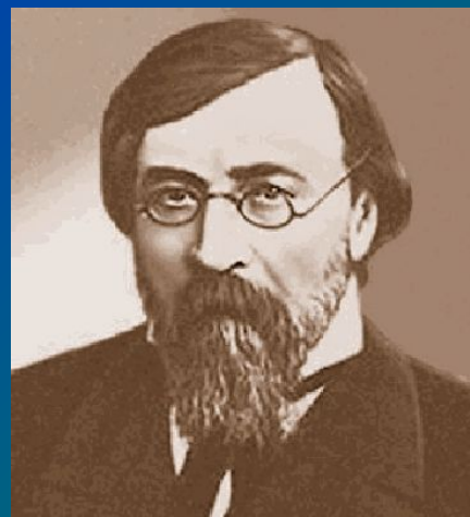
А.И.Герцен (либерал- славянофил)