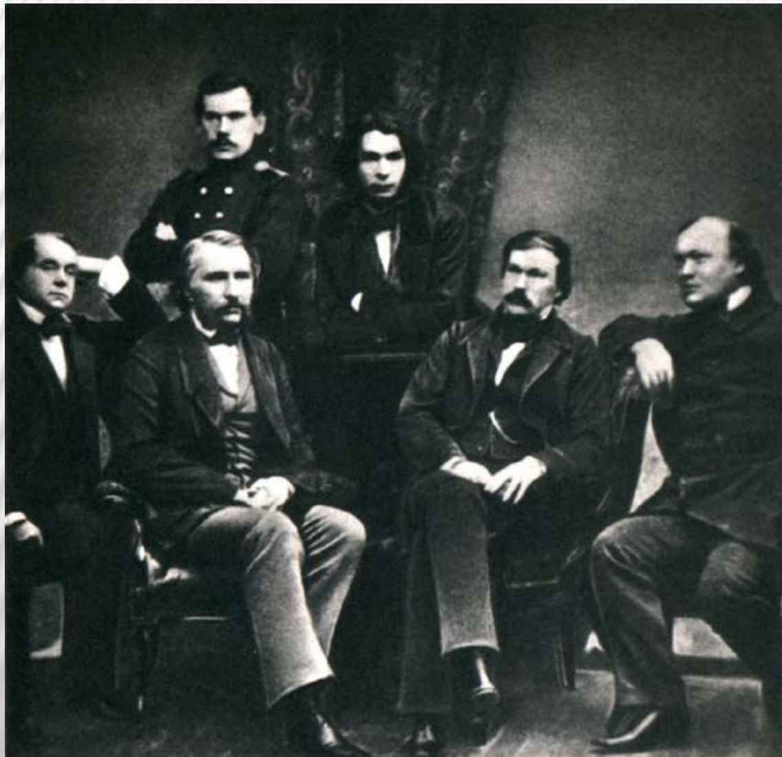
Н.А. Некрасов, И.С. Тургенев, И.А. Гончаров, А.В. Дружинин, А.Н. Островский, Н.Г. Чернышевский