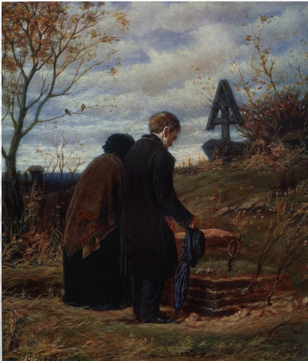
Василий Перов «Старики родители на могиле сына»