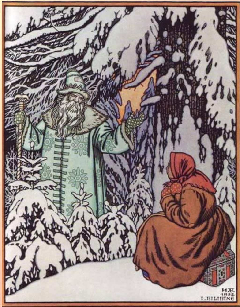
Репродукция картины И.Я.Билибина «Морозко»