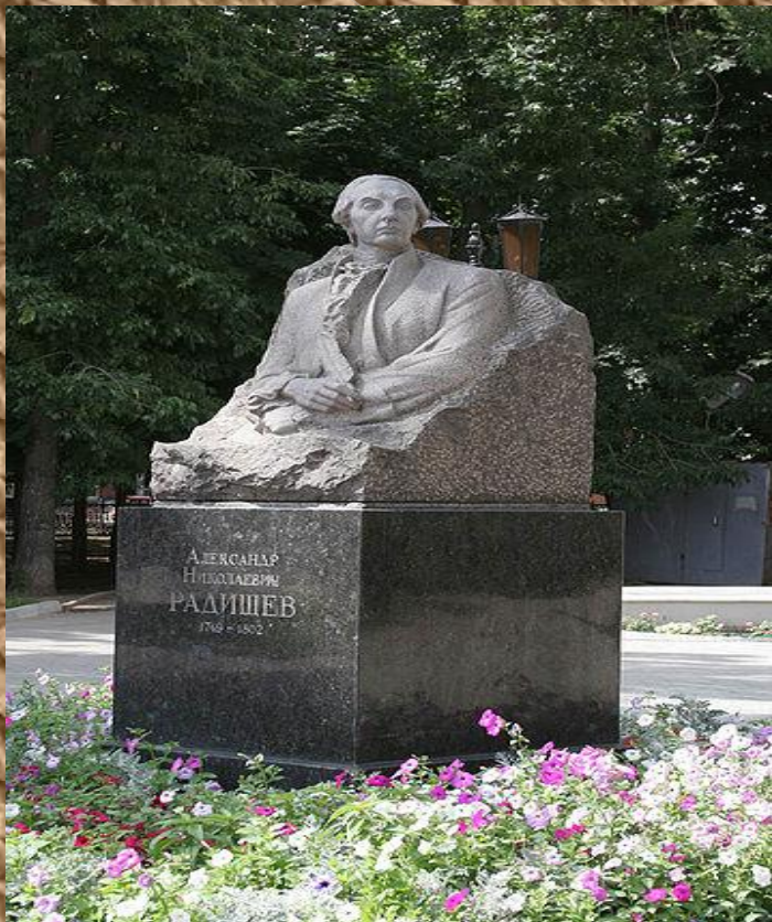
Памятник А. Н. Радищеву в Саратове