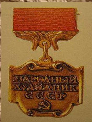
Нагрудный знак «Народный художник СССР»