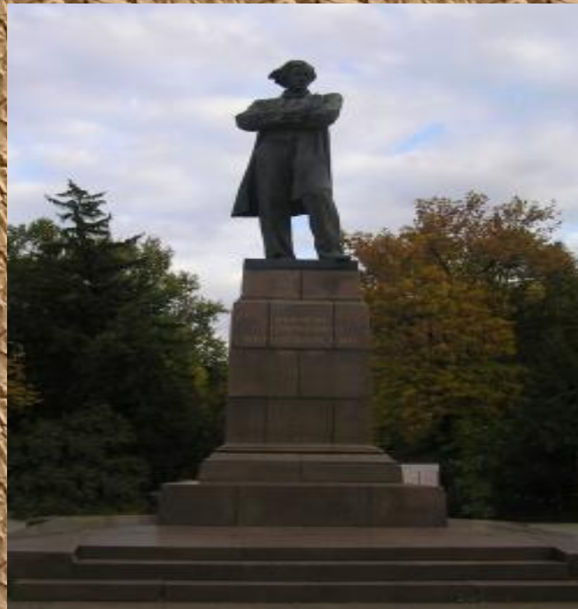
Памятник Н. Г. Чернышевскому в Саратове