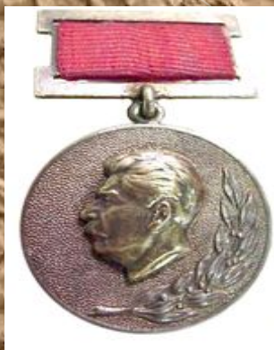
Сталинская премия второй степени (1949) — за скульптурный портрет Г. Чернышевского , выполненный из бронзы (1948)