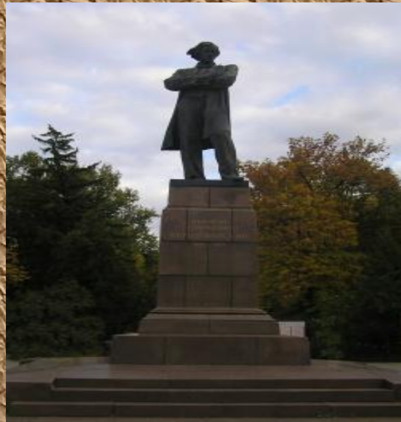
Памятник Н. Г. Чернышевскому в Саратове