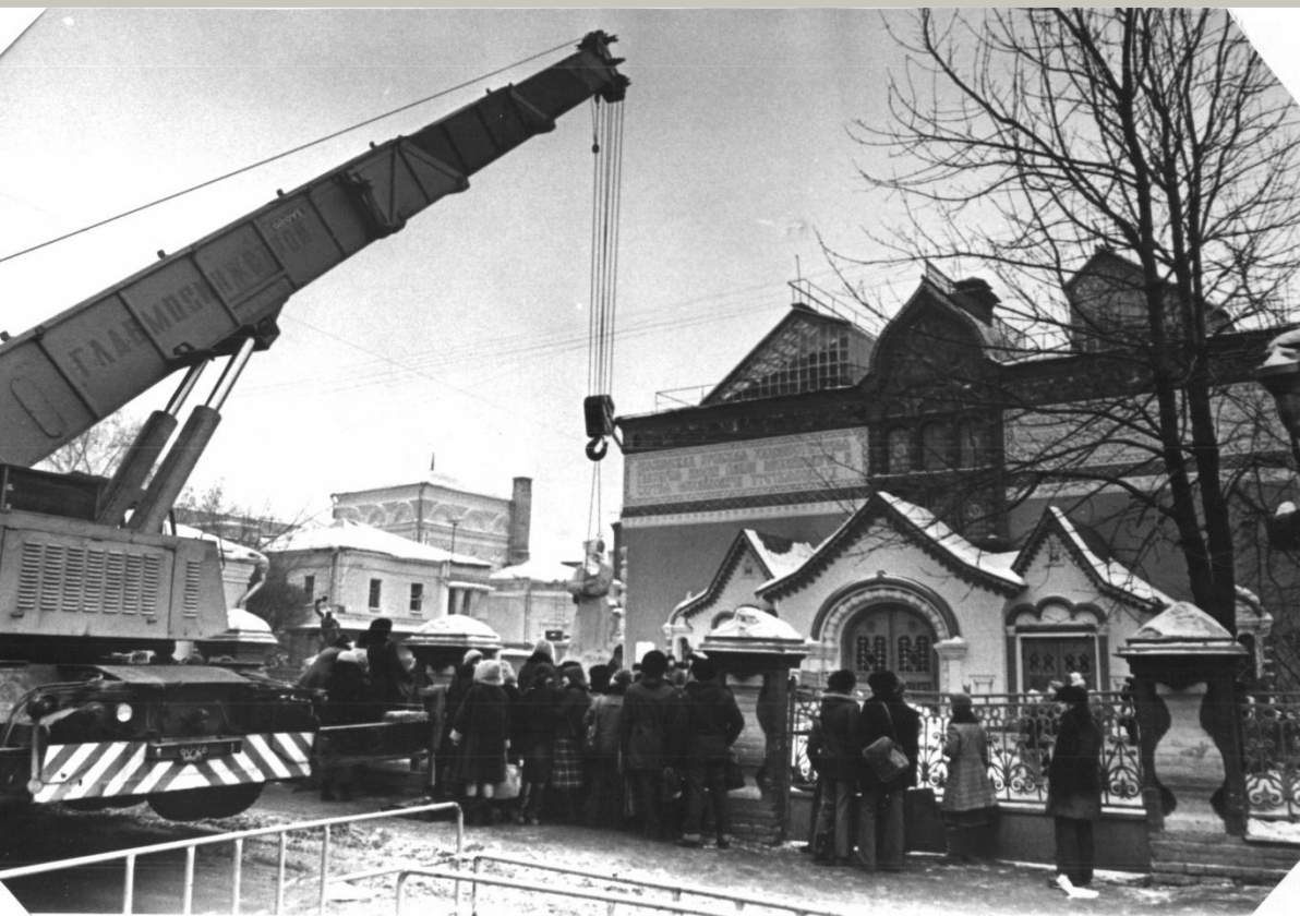
Установка памятника П.М. Третьякова