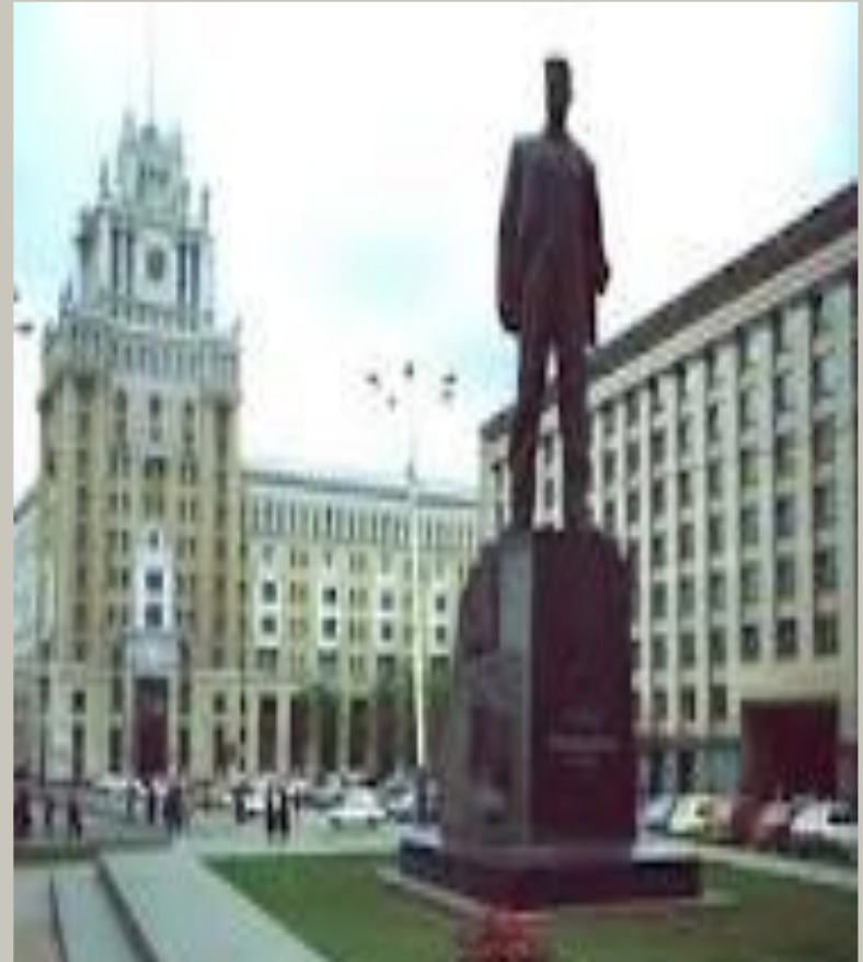
Памятник В. В. Маяковскому Москве