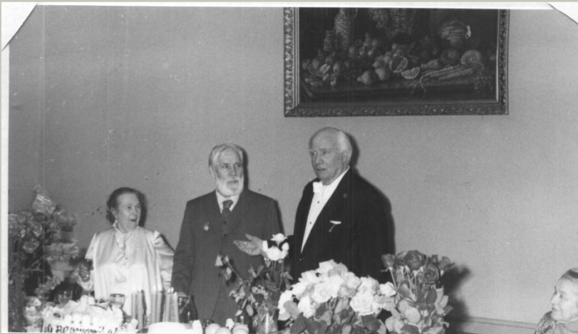
Рядом с супругами знаменитый тенор И.С. Козловский, народный артист СССР