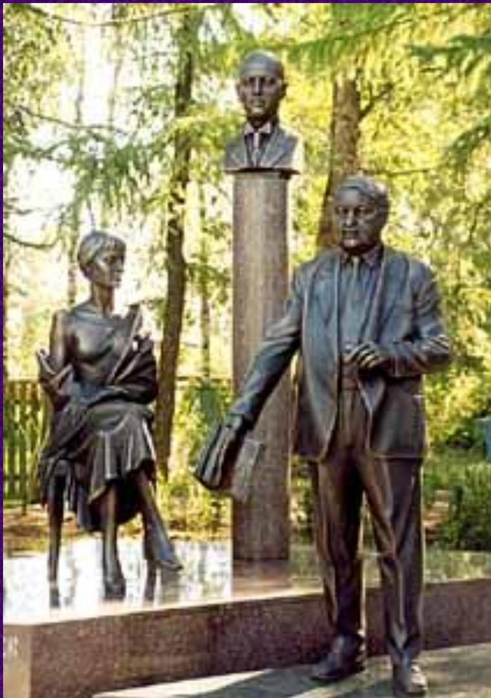
Скульптурная композиция «Семья Гумилевых» в Бежецке Автор: Андрей Ковальчук