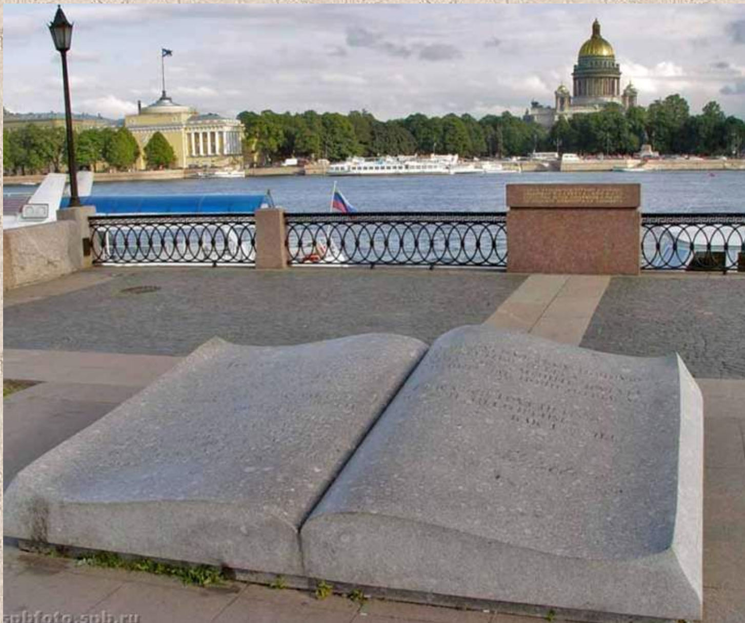
Россия. Санкт-Петербург. Книга на Университетской набережной. На книге высечены строки Пушкина “Люблю тебя, Петра творенье...”