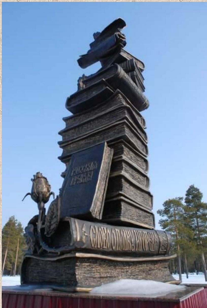
Памятник работы З. Церетели