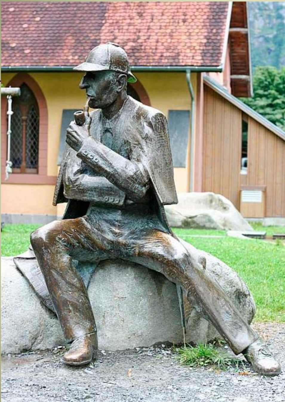
Шерлок Холмс (Швейцария)