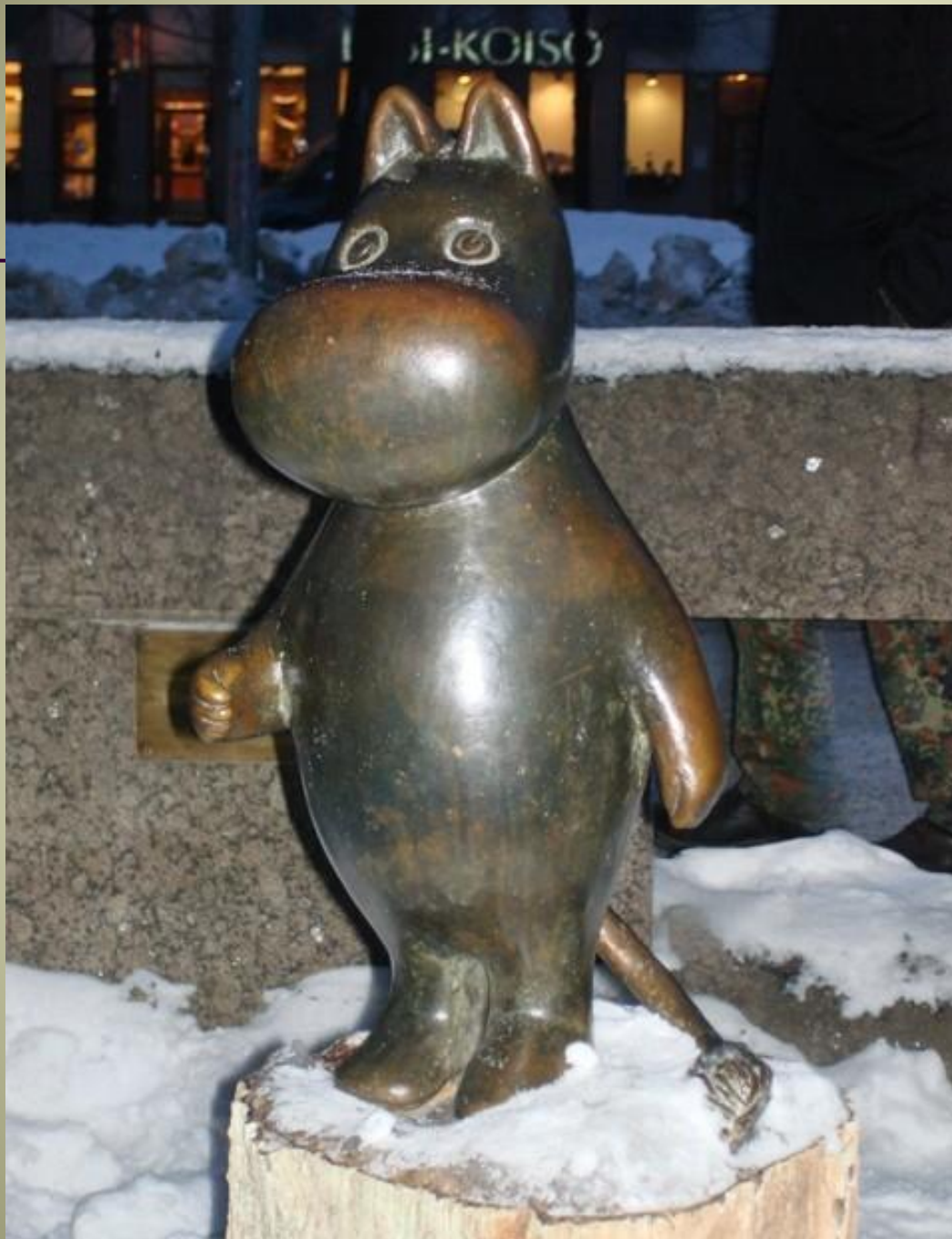
Муми- Троль (Финляндия)