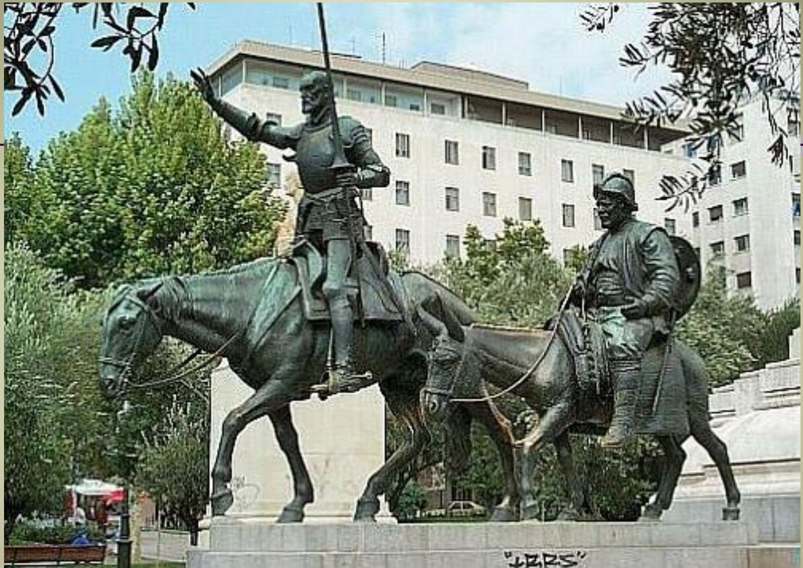
Дон Кихот и Санчо Панса (Испания, Мадрид)