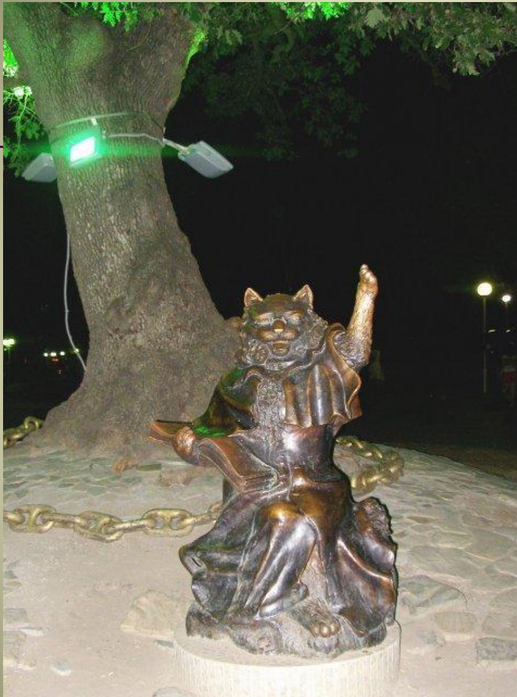
Кот учёный (Россия, Геленджик)