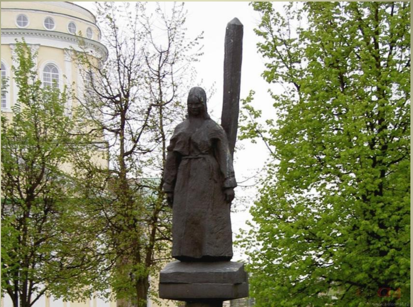
Леди Макбет Мценского уезда