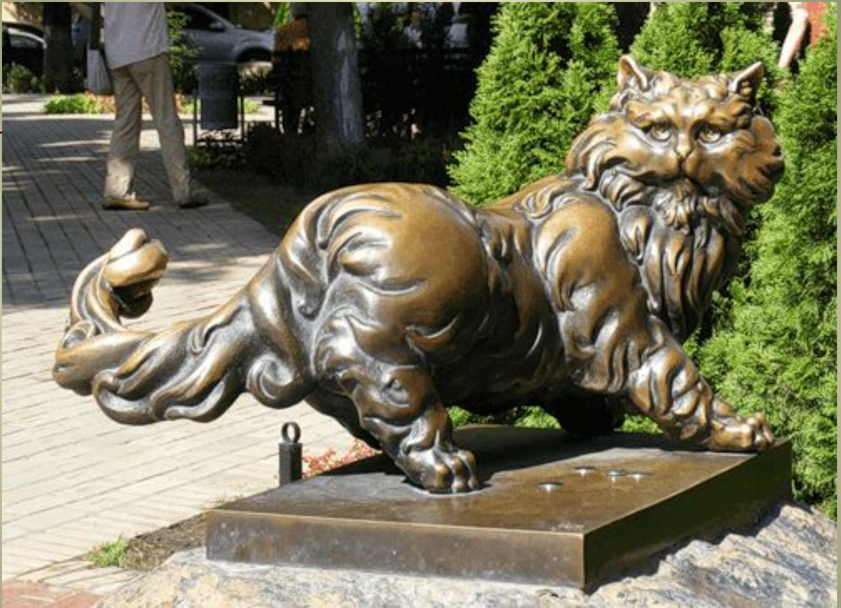
Кот Баюн (Киев)