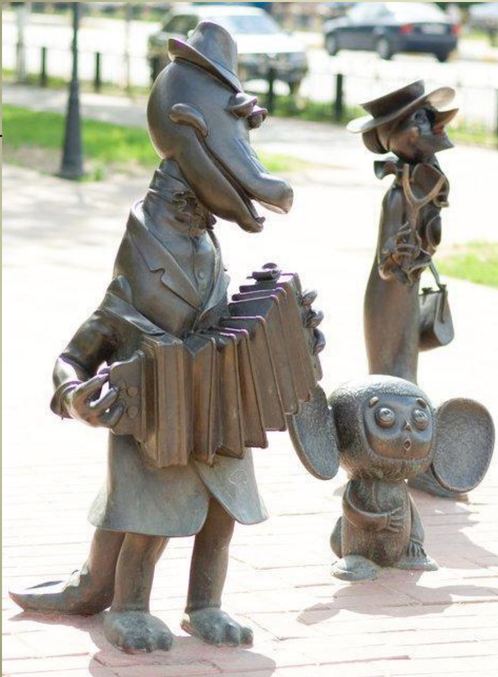
Крокодил Гена и его друзья (Московская область, Раменское)