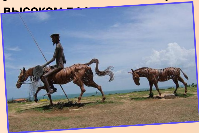
Это Дон Кихот из