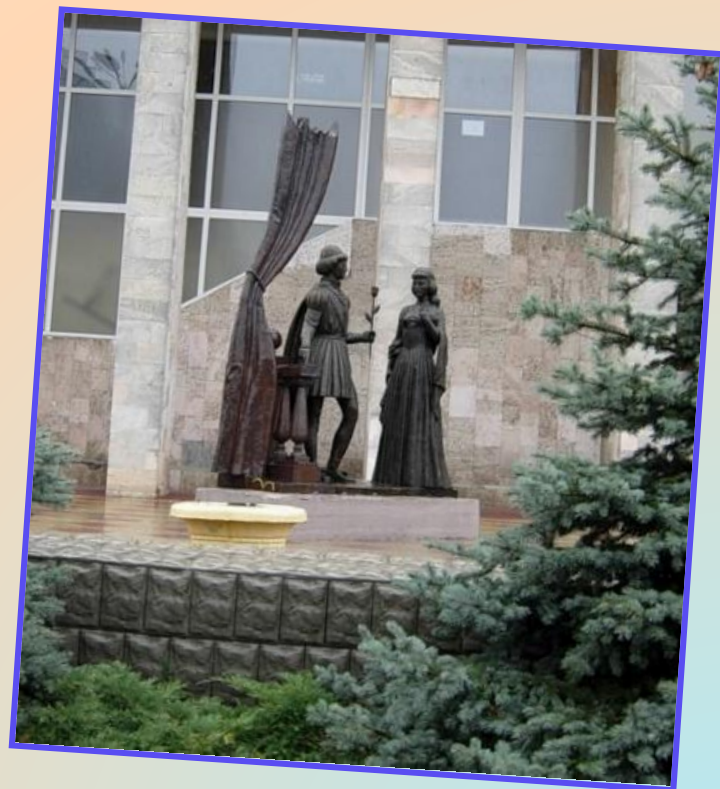
Брюссельский памятник Золушке