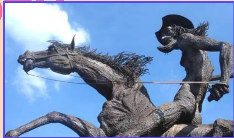
Так видят Дон Кихота кубинцы

Классический памятник в Мадриде, Испания. Копия этого памятника установлена также в Брюсселе на высоком холме.