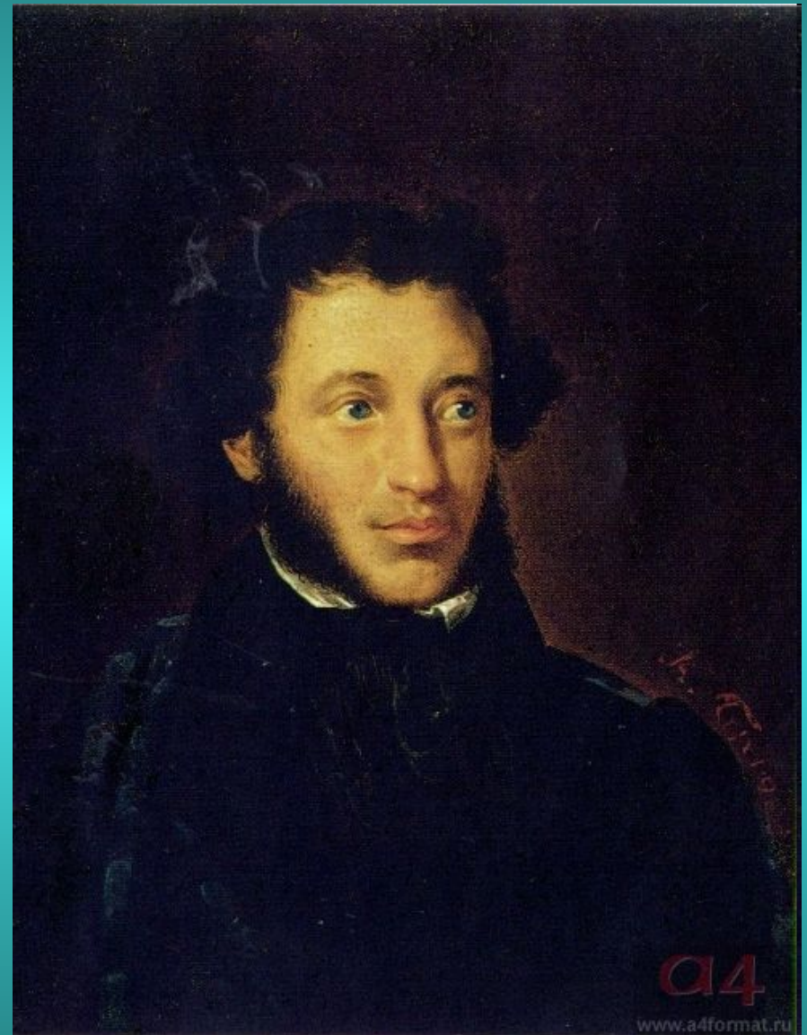
Портрет А.С.Пушкина. 1837г.

« Веселое имя: Пушкин » — по словам русского поэта XX в. Александра Блока — стало паролем русской культуры.