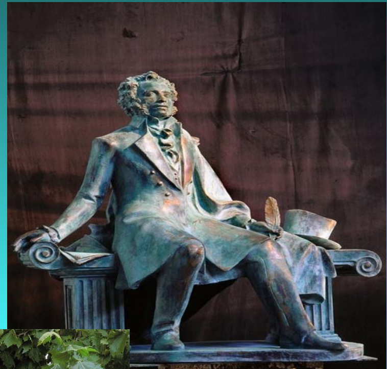
Памятник А.С. Пушкину в Минске