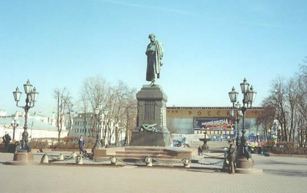
Памятник А.С. Пушкину в Москве скульптор А. М. Опекушин, архитектор постамента - В. А. Петров.

21 августа 1836 г., словно предчувствуя скорое расставание с жизнью, Пушкин подводит итог своему творчеству: