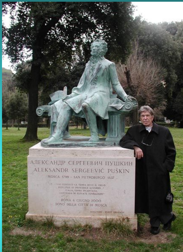
Памятник А.С. Пушкину в Риме