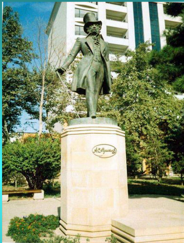
Памятник А.С. Пушкину в Баку