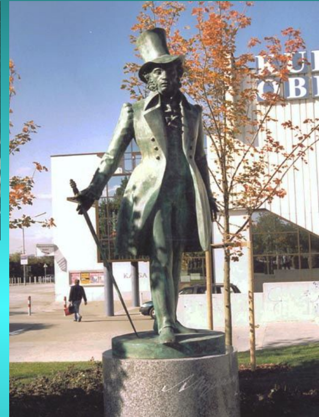
Памятник А.С. Пушкину в Вене