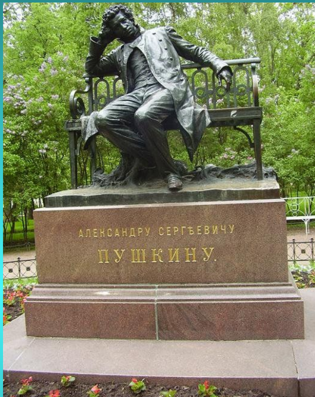
Памятник А.С. Пушкину в Царском Селе (г. Пушкин)