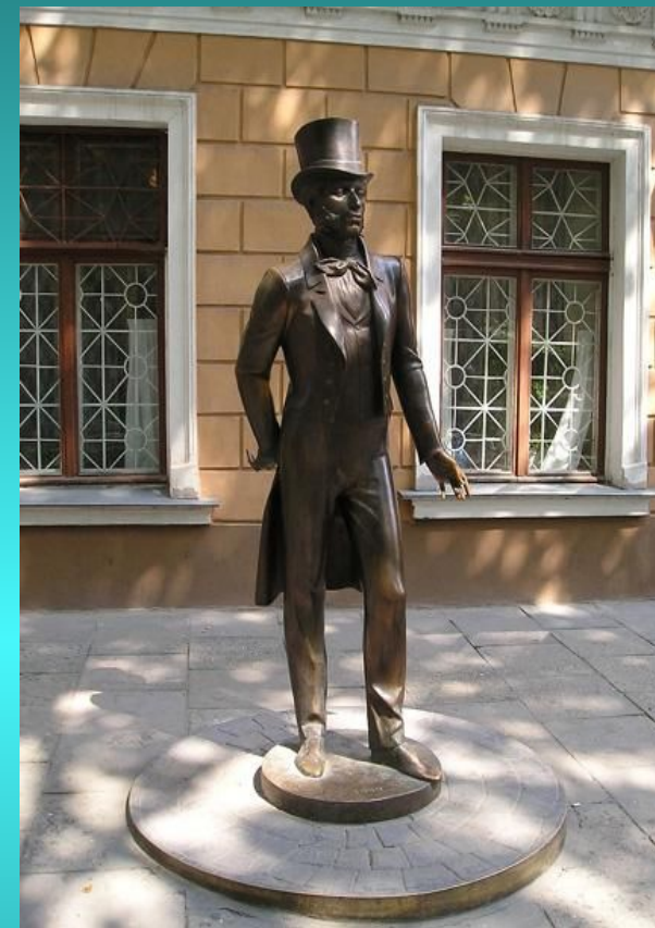
Памятник А.С. Пушкину в Одессе