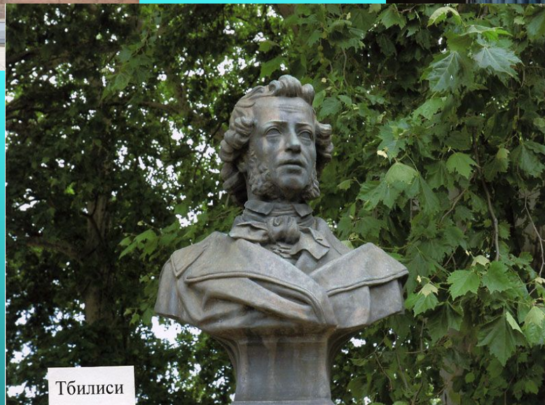
Памятник А.С. Пушкину в Тбилиси