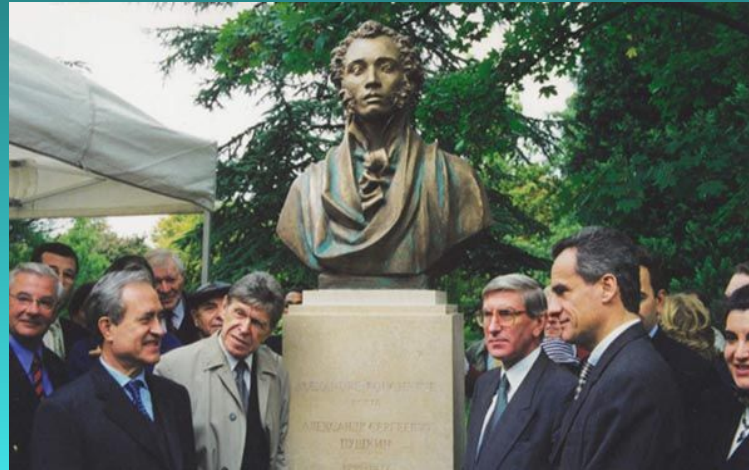
Памятник А.С. Пушкину в Париже