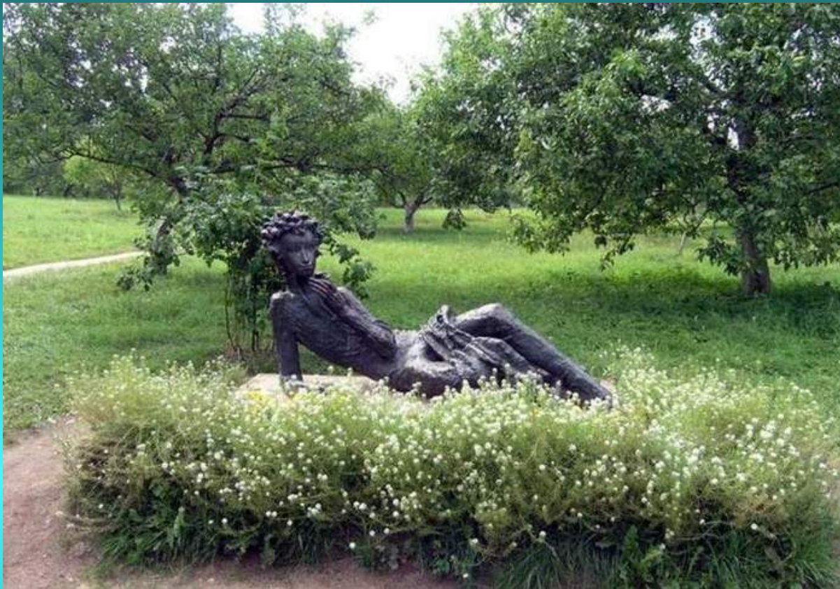
Памятник в Михайловском