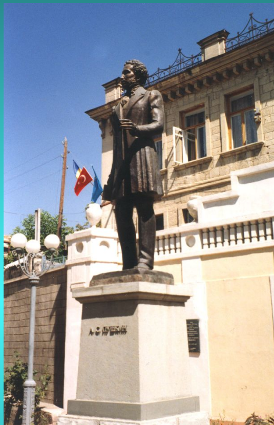
Памятник А.С. Пушкину в Крыму