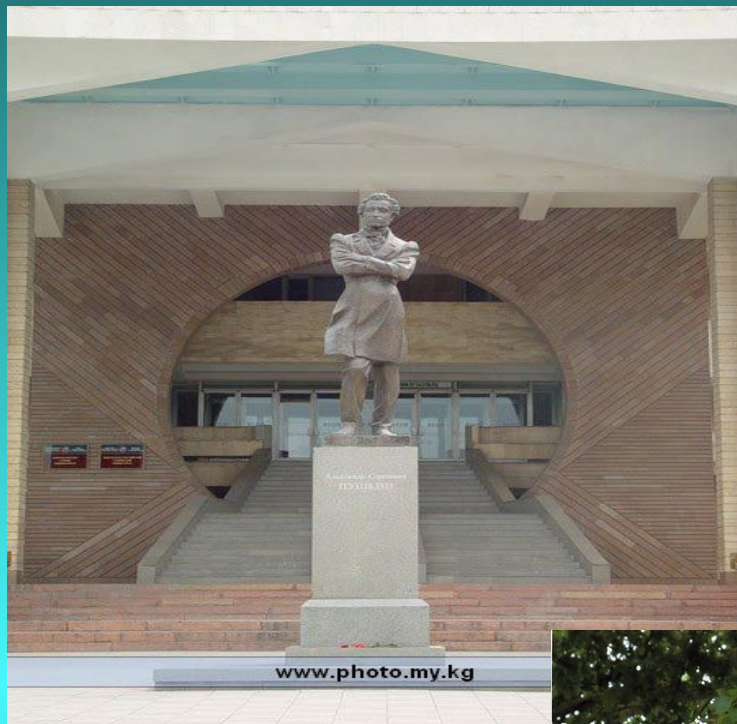
Памятник А.С. Пушкину в Киргизстане (г. Бишкек)