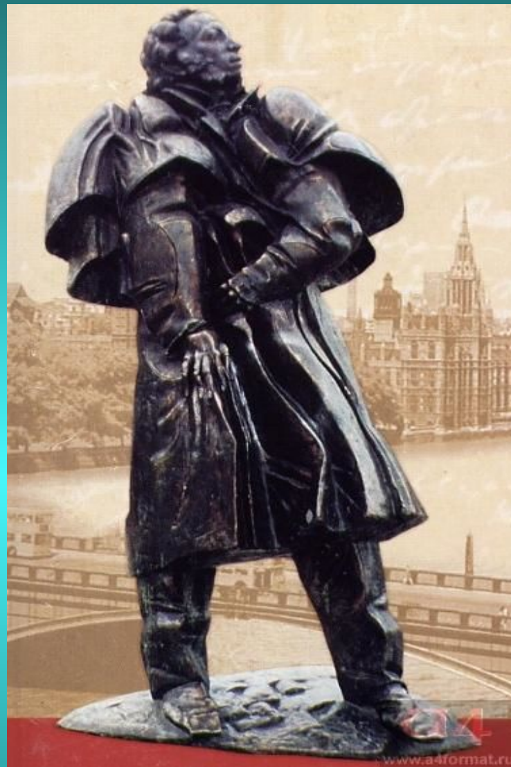
Памятник А.С. Пушкину в Брюсселе.