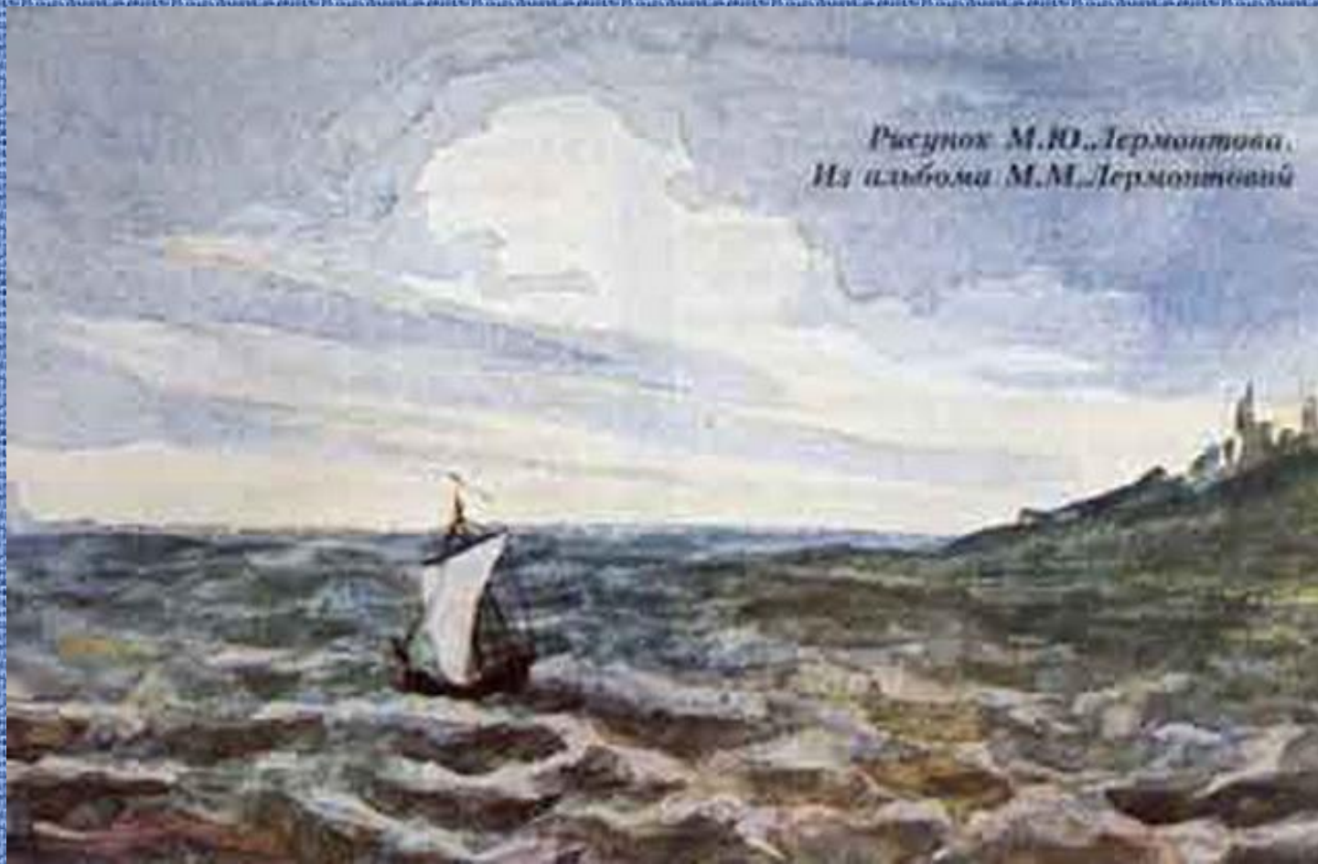
Рисунок М.Ю. Лермонтова