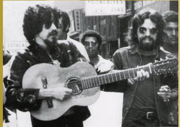
Рауль Сейшас (зліва) та Пауло Коельо (справа)

Проте влада звернула увагу на підривну, з їхньої точки зору, діяльність тандему й заарештувала обох «дисидентів».