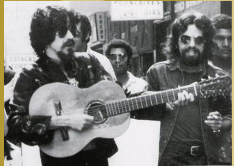
Рауль Сейшас (зліва) та Пауло Коельо (справа)

Проте влада звернула увагу на підривну, з їхньої точки зору, діяльність тандему й заарештувала обох «дисидентів».