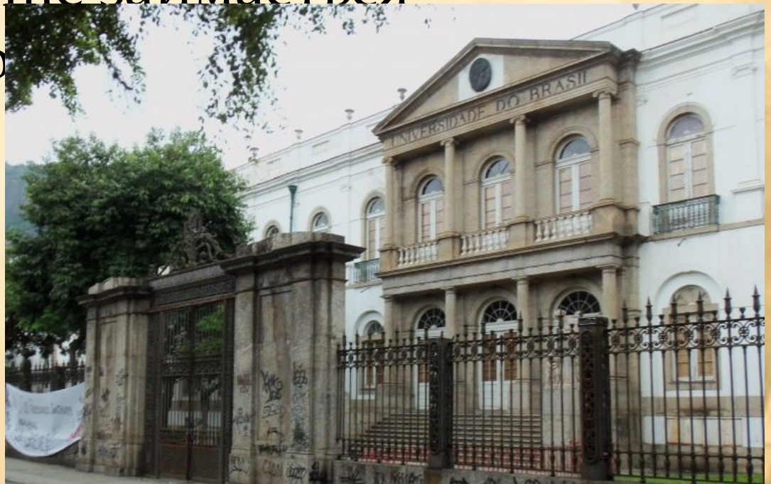
Університет в Ріо-де-Жанейро

Бажання стати письменником не знайшло розуміння у його родини, тому під їх тиском він вступає на юридичний факультет університету Ріо-де-Жанейро, але невдовзі кидає навчання і більше займається журналістикою