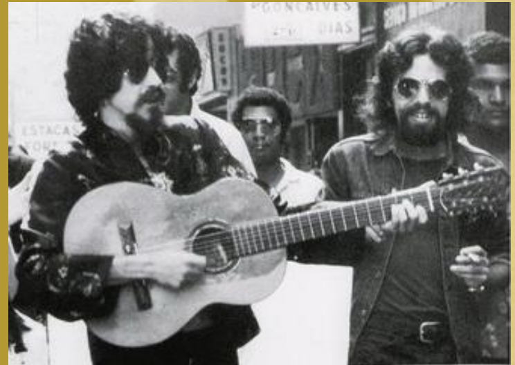
Рауль Сейшас (зліва) та Пауло Коельо (справа)

Проте влада звернула увагу на підривну, з їхньої точки зору, діяльність тандему й заарештувала обох «дисидентів».