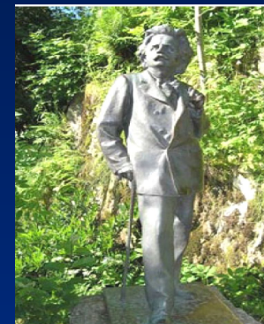
Где Дагни встретила Э. Грига