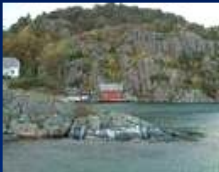
Это - Норвегия