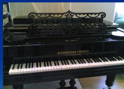
Он посвятил ей музыкальную пьесу