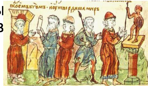
Заключение договора князя Олега с греками