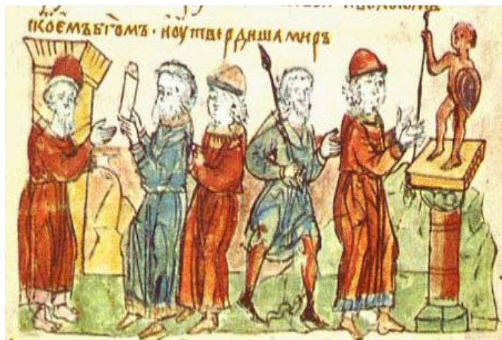
Заклучение договора князя Олега с греками