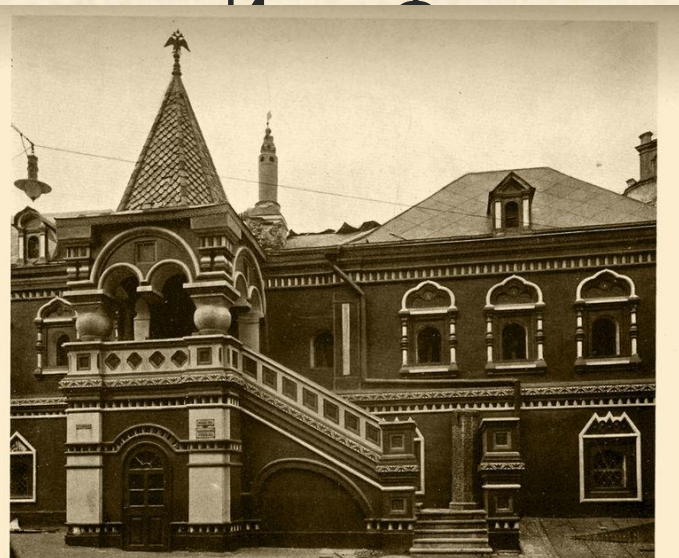
Печатный двор (Синодальная типография).

Открыл он ее по царскому велению. Печатный станок тогда был делом государственной важности, и без указания царя никто книгопечатанием заняться не смел. Ведь правил тогда Иван Грозный — царь страшный и жестокий. Зато значение книги царь понимал и, решив не отставать от Европы, повелел построить Государев Печатный двор. Стоял он в Москве, в Китай-городе (кстати, здание корректорской, или, как ее тогда называли, "правильни" стоит там до сих пор). Его руководителем и стал церковный будущий первопечатник.