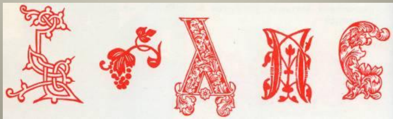
Украшения из книг Ивана Фёдорова