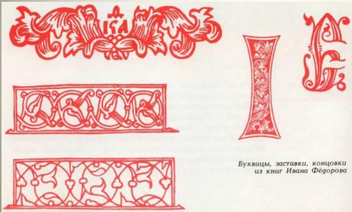
Буквицы, заставки, концовки из книг Ивана Фёдорова