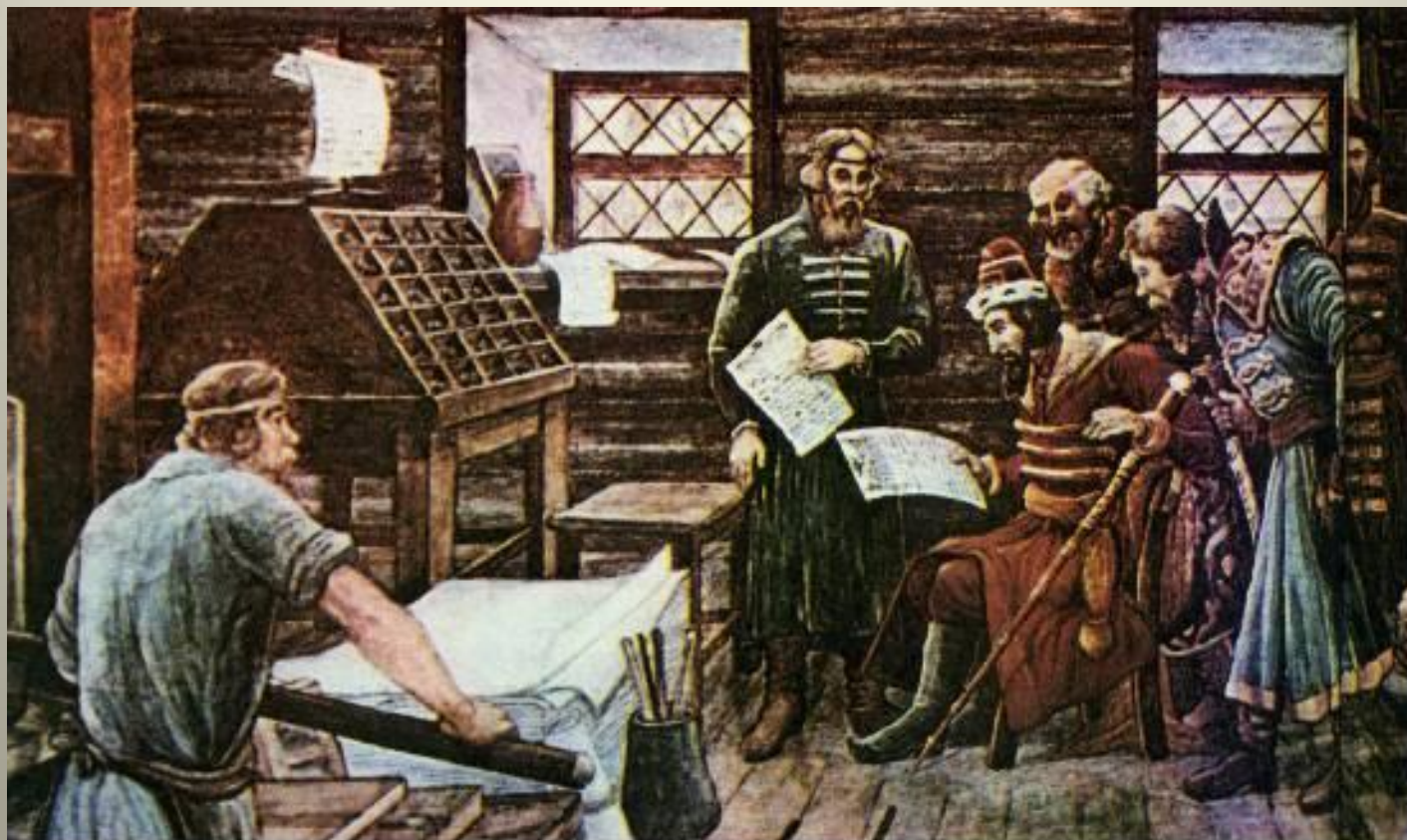
Иван IV в типографии Ивана Фёдорова (с картины художника Г. Лиснера)