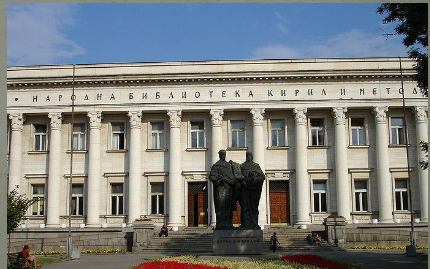
Библиотека в Софии