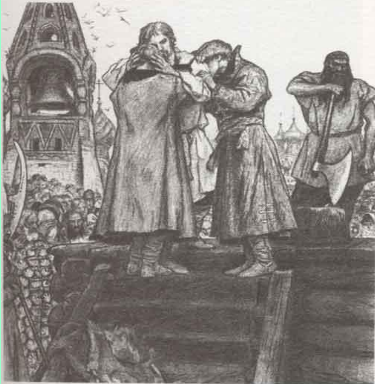
«Песня про... купца Калашникова». Илл. В. М. Васнецова. 1891.