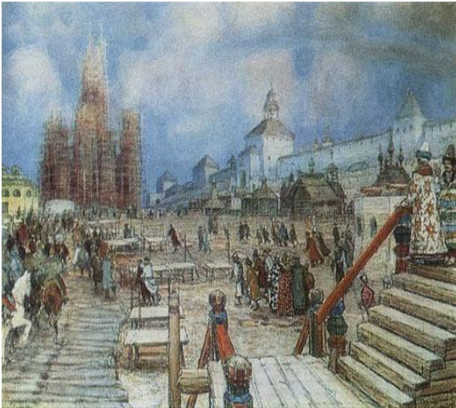
Москва эпохи Ивана Грозного