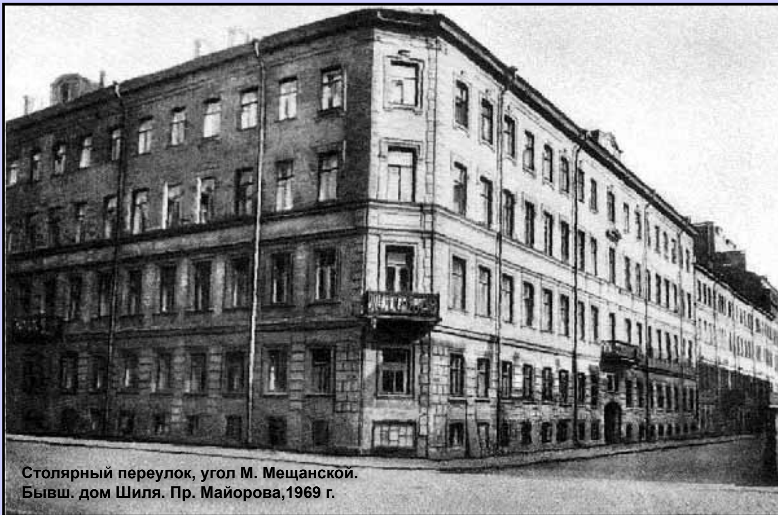
Столярный переулок, угол М. Мещанской. Бывш. дом Шиля. Пр. Майорова, 1969 г.

В Столярном переулке, в доме №19/5 Достоевский поселил Раскольников. «Во внутреннем дворе, справа, есть парадная. Там, на последнем этаже, тринадцать ступеней ведут наверх, в квартиру Раскольникова».