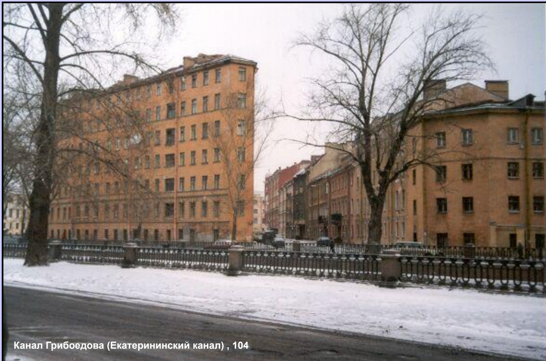
Канал Грибоедова (Екатерининский канал) , 104

Недалеко, на противоположной стороне Екатерининского канала, в доме № 104 жила Алена Ивановна, кредиторша Раскольникова.