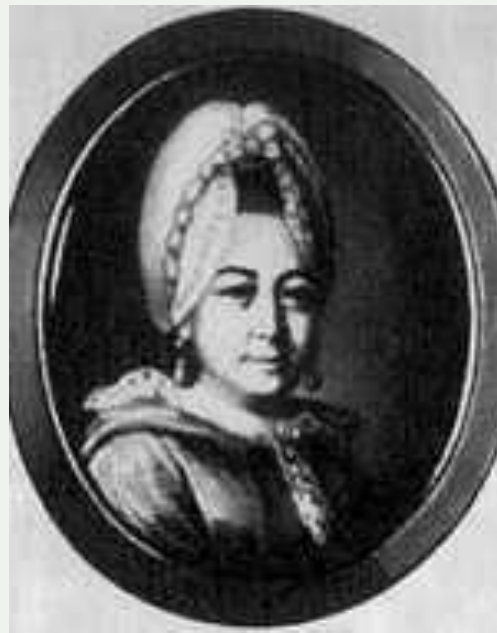
Бабушка, Мария Алексеевна Ганнибал (1745-1818 )