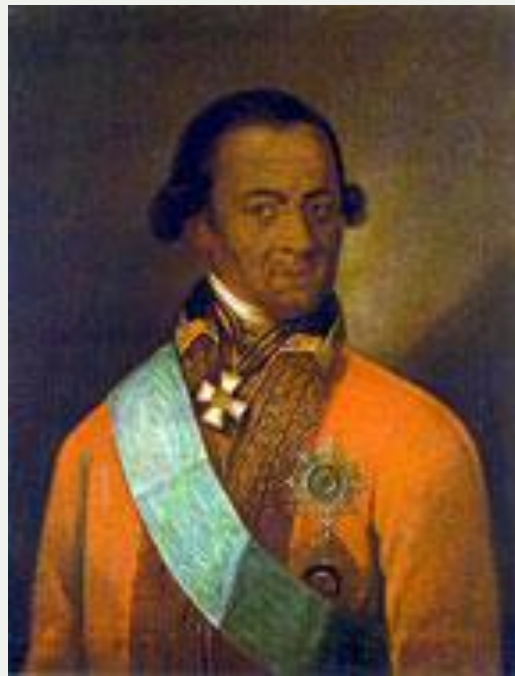
Прадедушка, Абрам Петрович Ганнибал