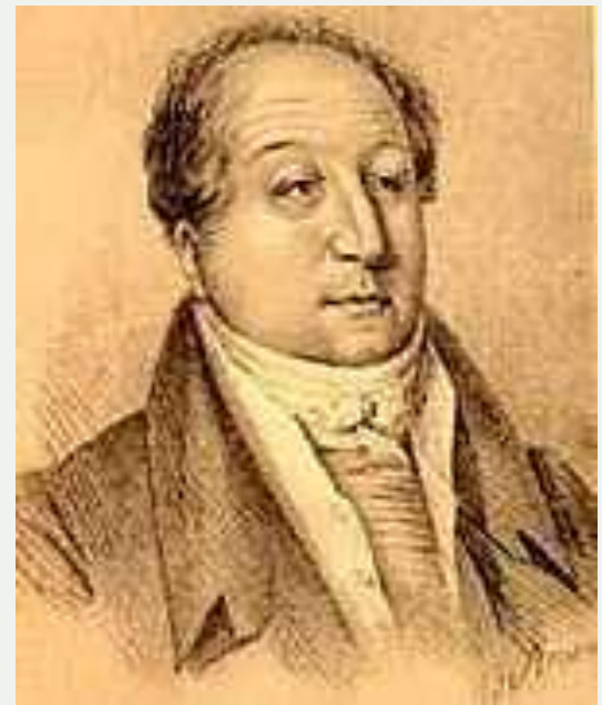
Дядя, Василий Львович Пушкин (1766-1830)