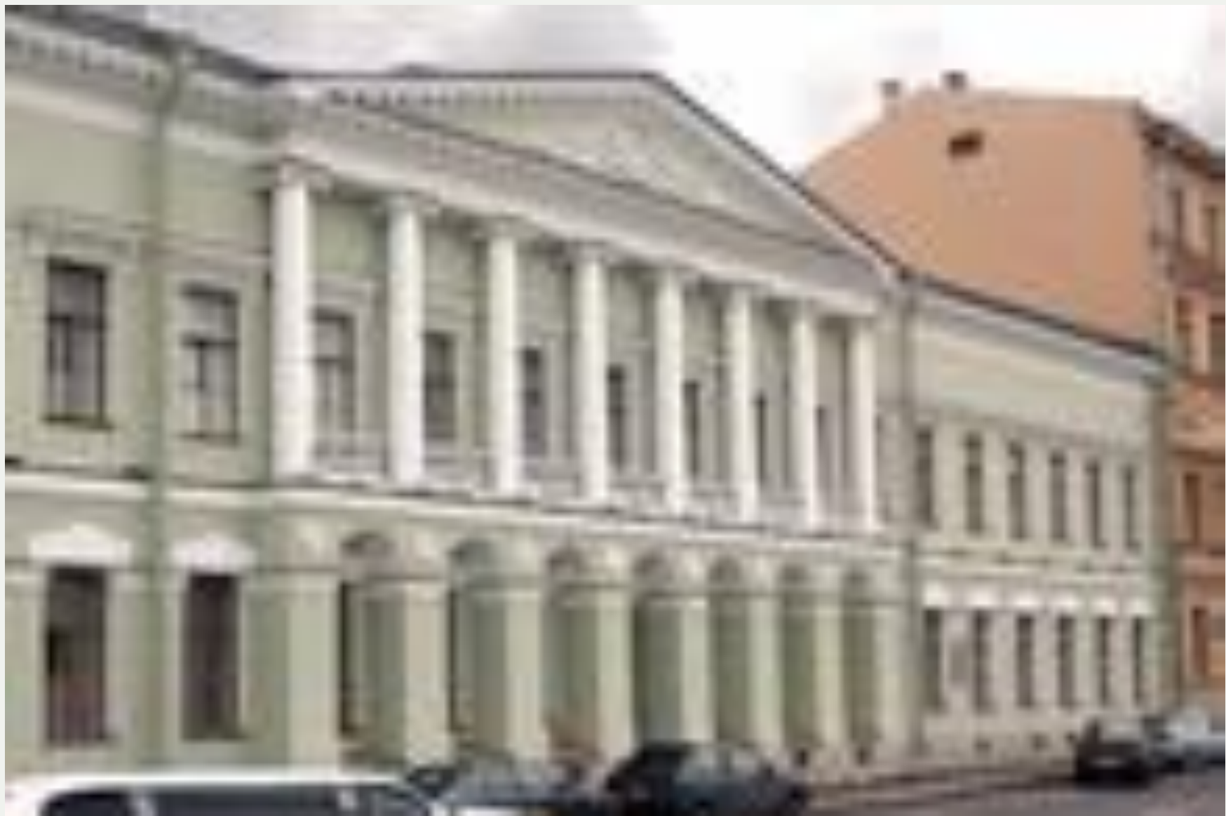
Коллегия иностранных дел